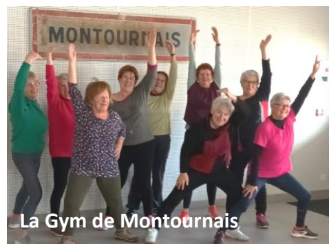
La Gym de Montournais

J'ai commencé le foot quand j'étais petite, je jouais avec mon grand-frère dans le jardin et à 6 ans mes parents m'ont inscrite au club de la Châtaigneraie.