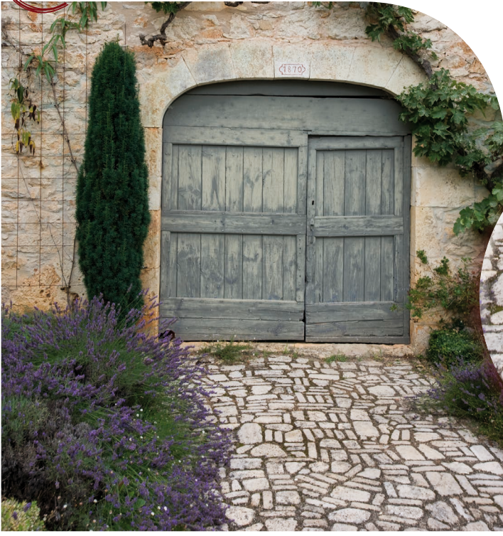
Réalisation d'une calade