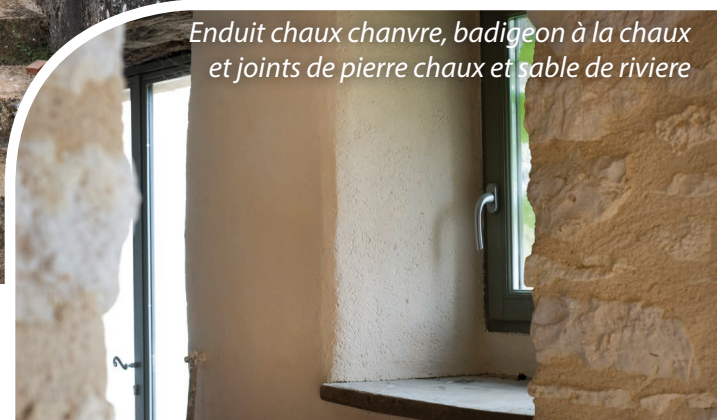
Enduit chaux chanvre, badigeon à la chaux et joints de pierre chaux et sable de rivière