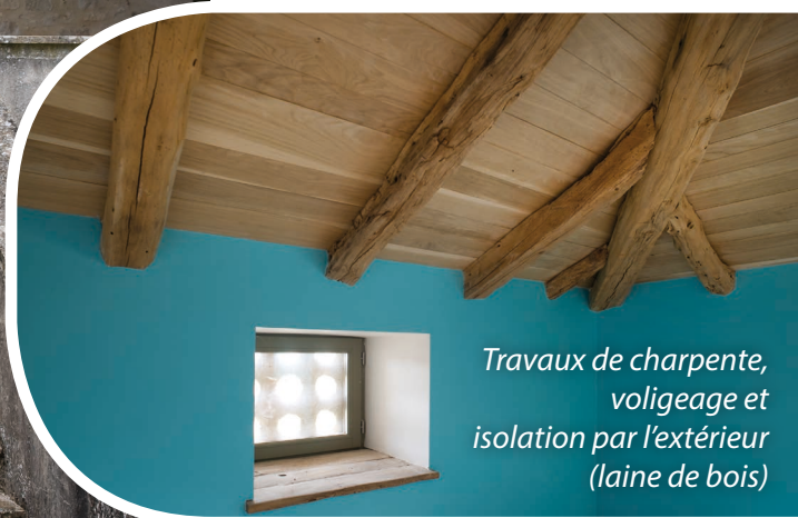
Travaux de charpente, voligeage et isolation par l'extérieur (laine de bois)