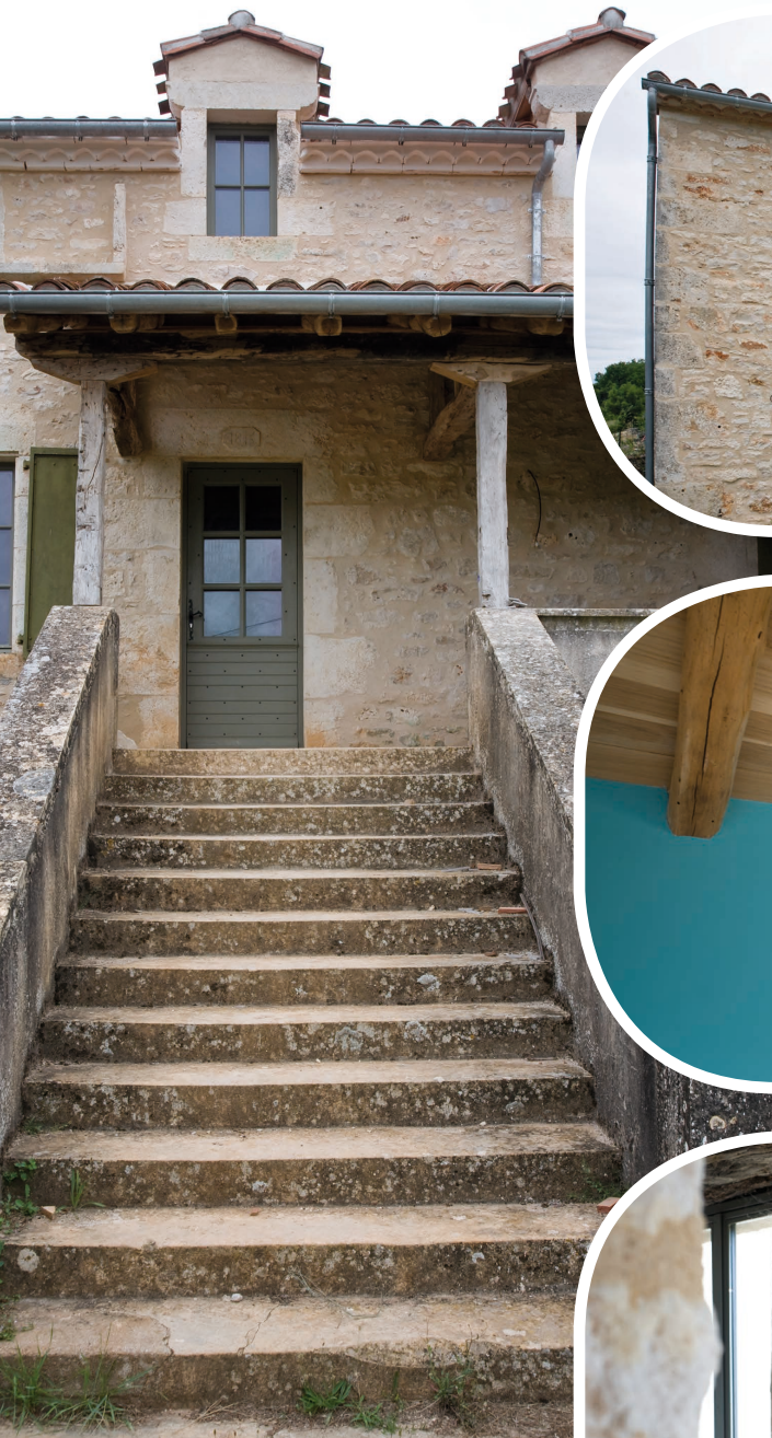
Création d'un bolet

Rénovation : maçonnerie, charpente et couverture