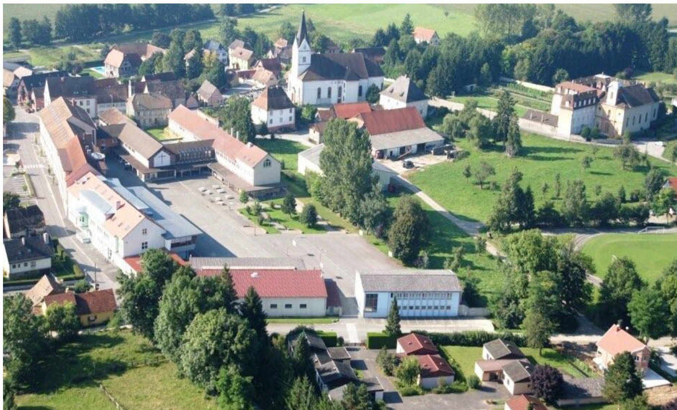
Vue sur la commune de Landser

Désignation du Commissaire-Enquêteur par décision de Madame la Vice-Présidente du Tribunal Administratif de Strasbourg sous le n° E25000144/67 en date du 22 octobre 2025