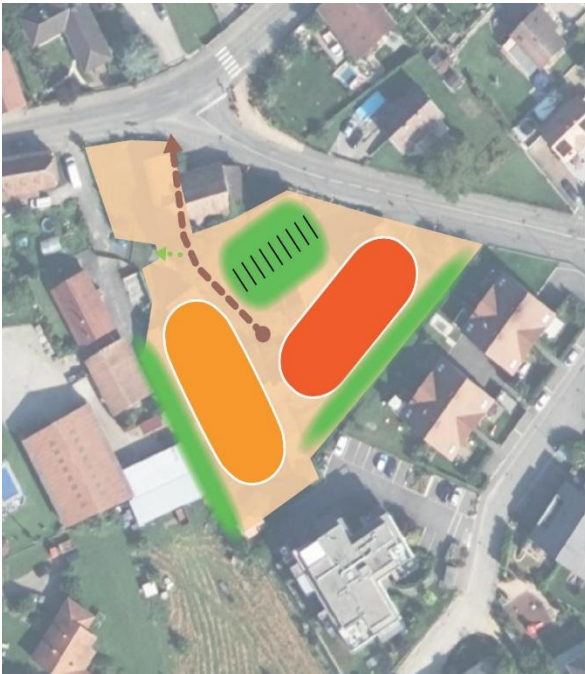
Rue du Rhin