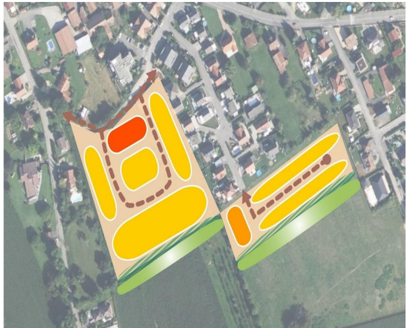
Rue du Kaegyberg et rue des Vergers