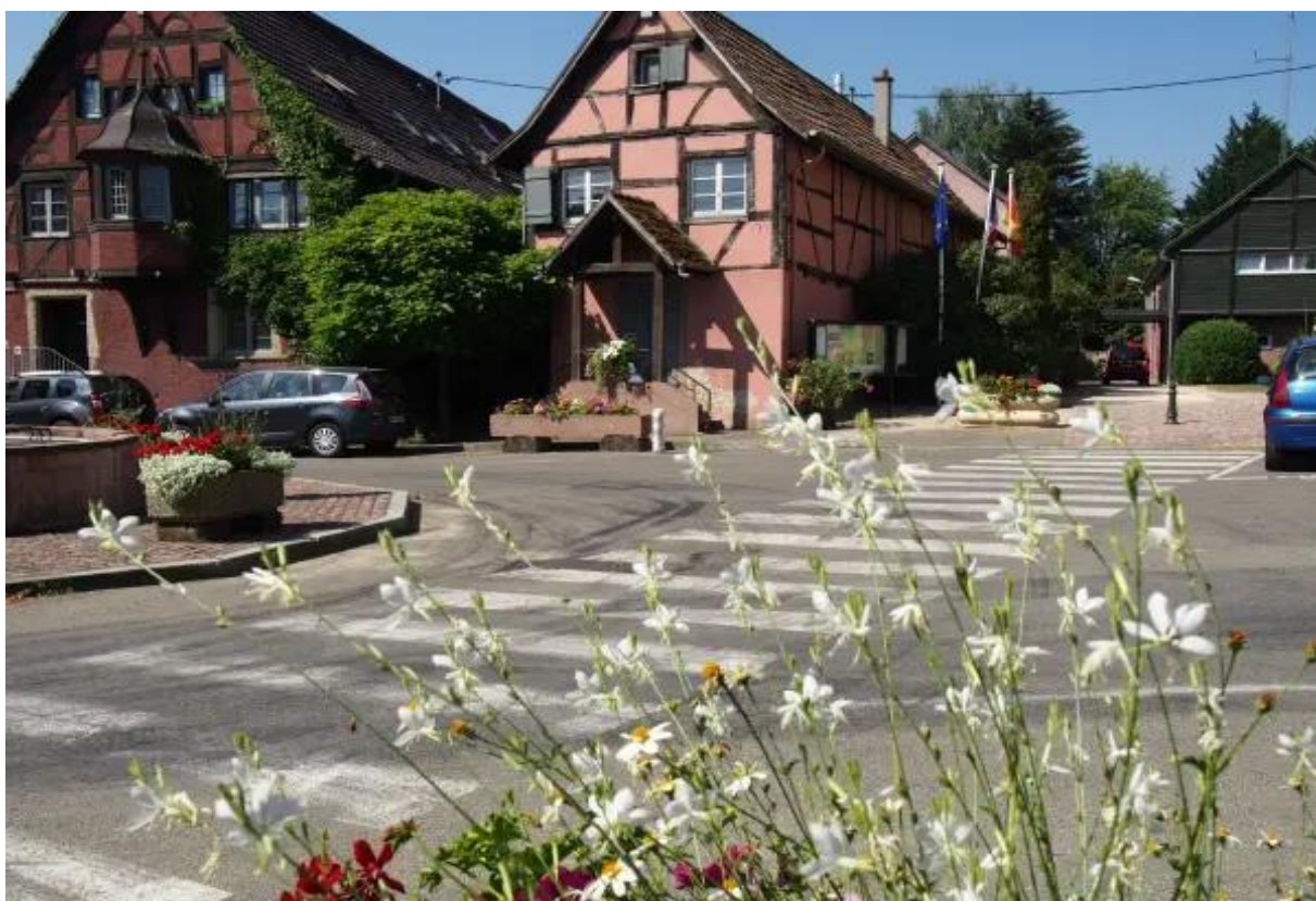
Vue sur Landser