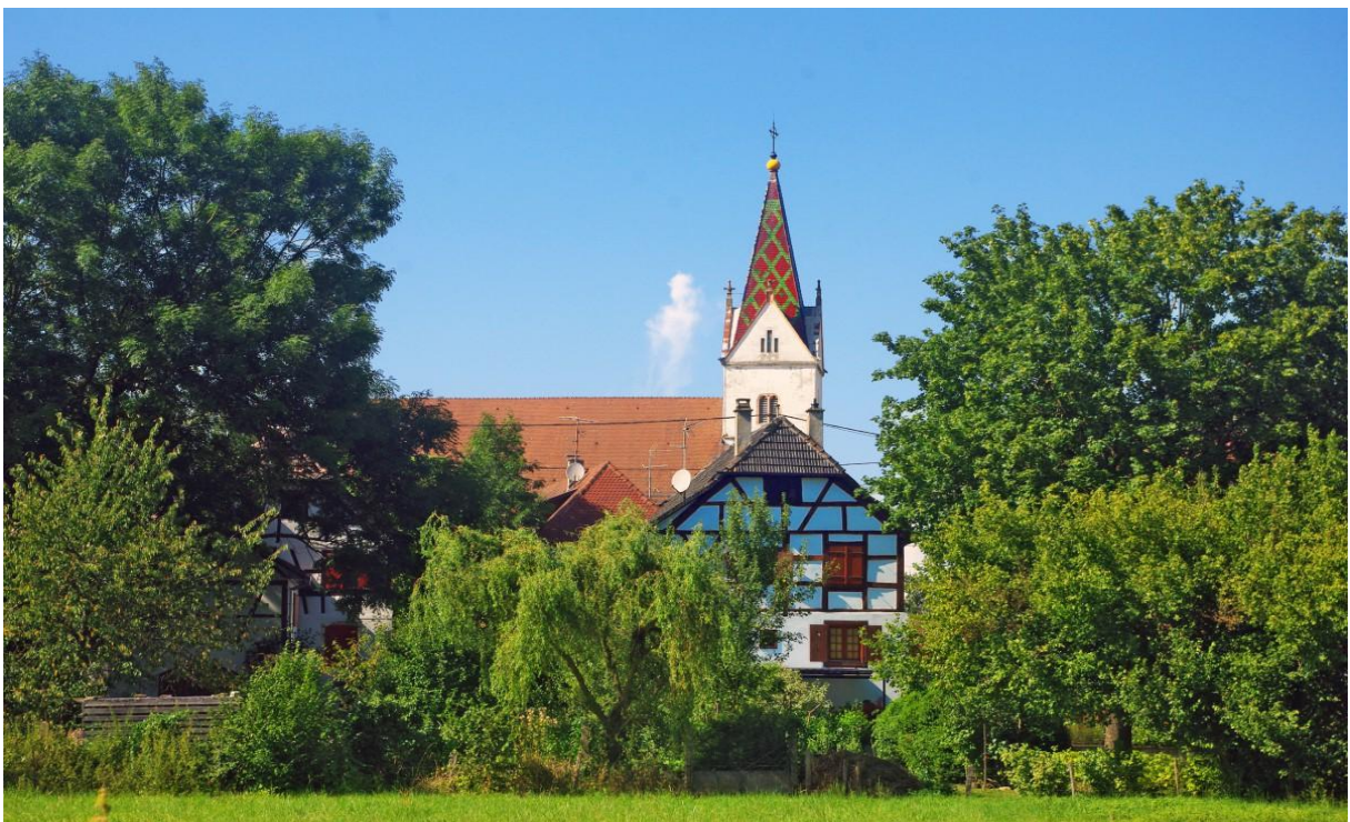
Vue sur la commune de Landser