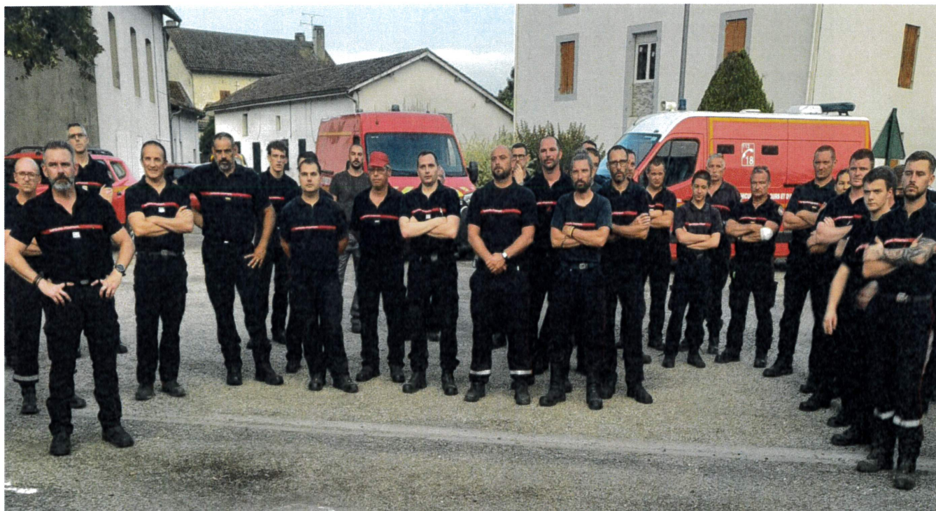
Une partie du groupe de sapeurs pompiers ayant participé à l'exercice

Cet exercice s'inscrit dans le cadre du lancement de la campagne estivale de lutte contre les feux de forêt et renforce la préparation face aux risques accrus liés à la sécheresse.