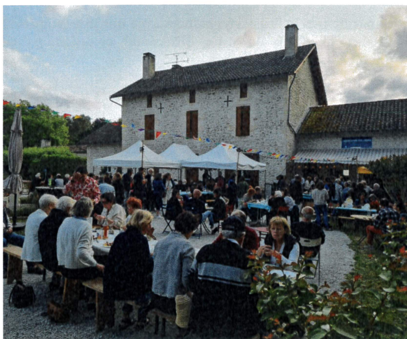
Deuxième anniversaire des Lugues – 7 juin 2025

Nous partons en congés estivaux le 15 juillet et vous retrouverons avec plaisir dès le mardi 29.