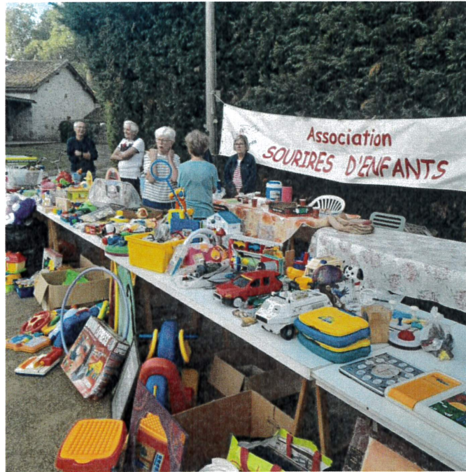
Vide grenier de PINDERES le 7 septembre