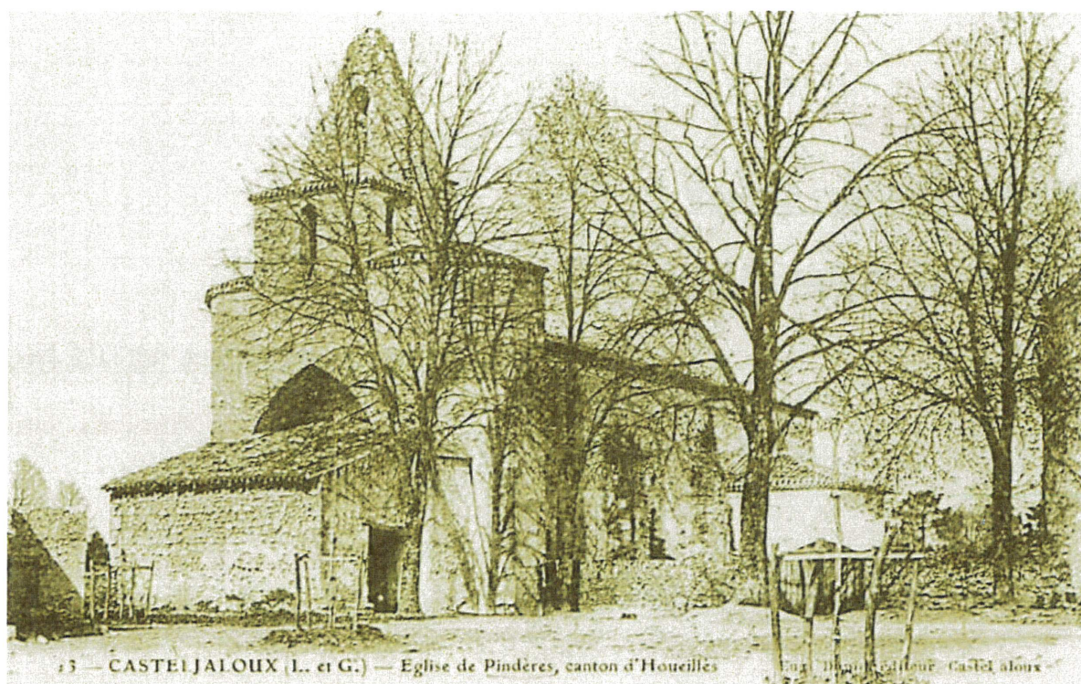
PINDERES dans les années 30