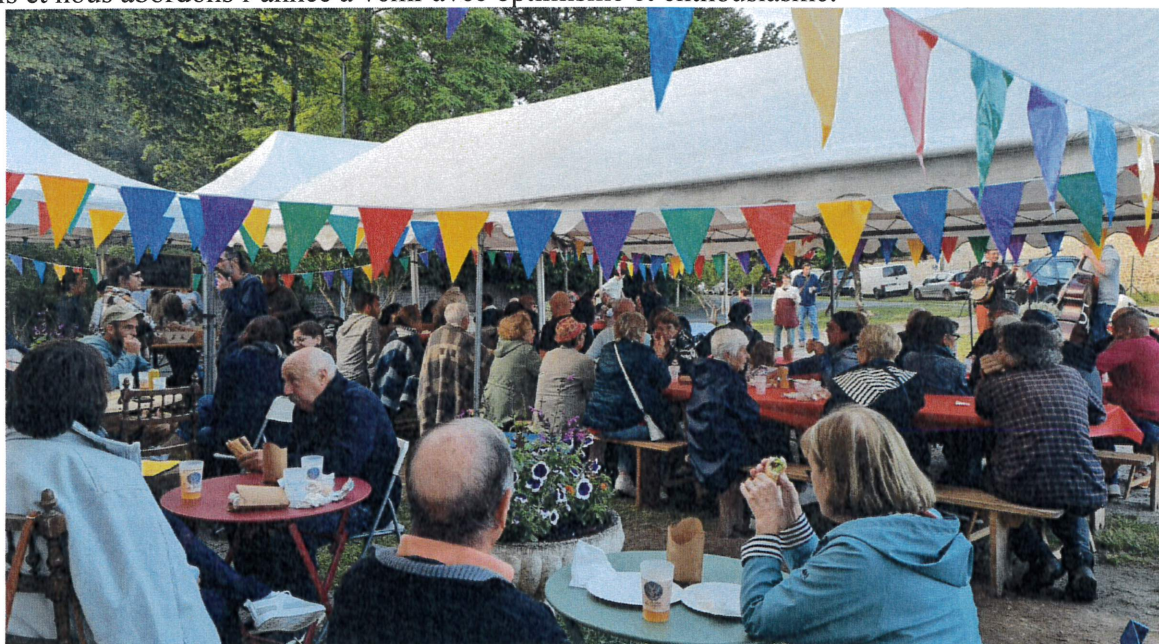
Journée festive au Comptoir des Lugues

Côté finances, notre gestion rigoureuse nous a permis d'embaucher une salariée à temps partiel pendant cinq mois et nous abordons l'année à venir avec optimisme et enthousiasme.