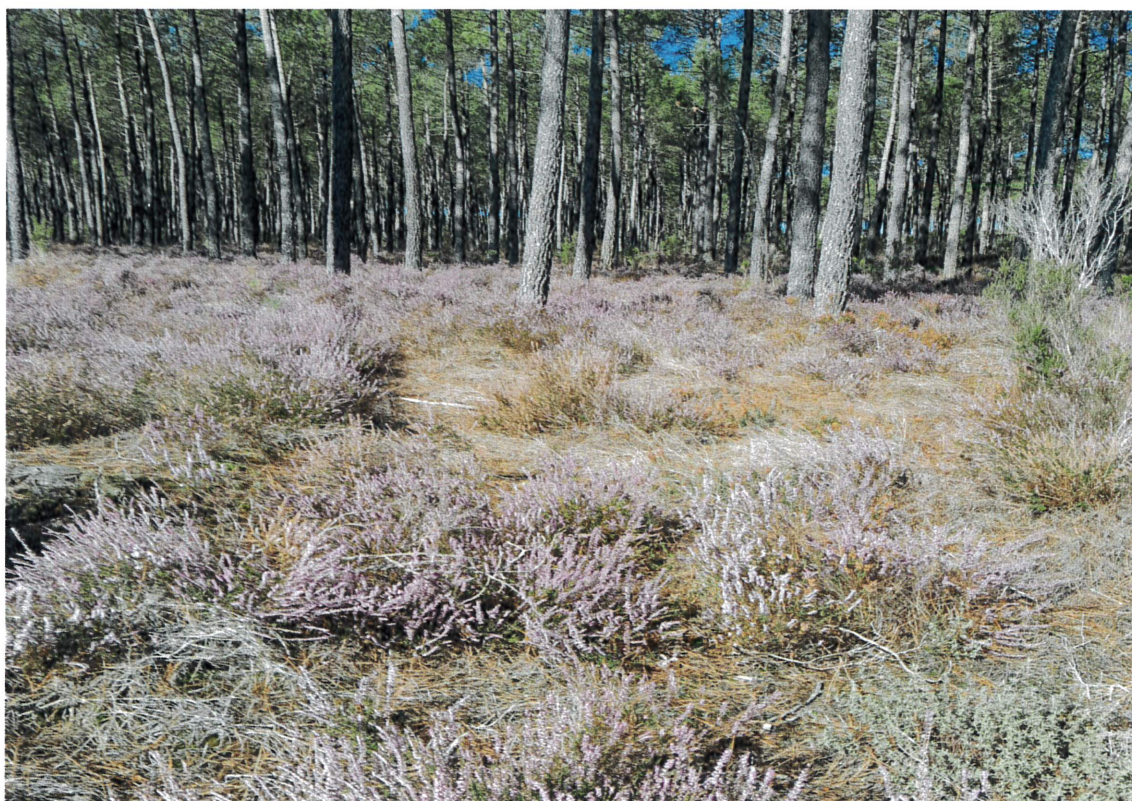
Paysage d'automne (la Bruyère ou Callune en fleur)