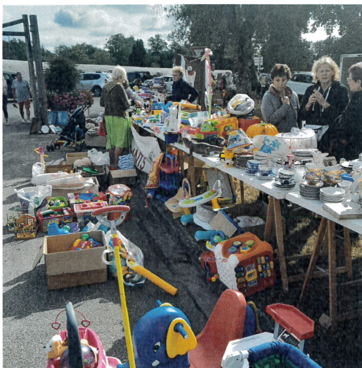
POMPOGNE le 18 août 2024