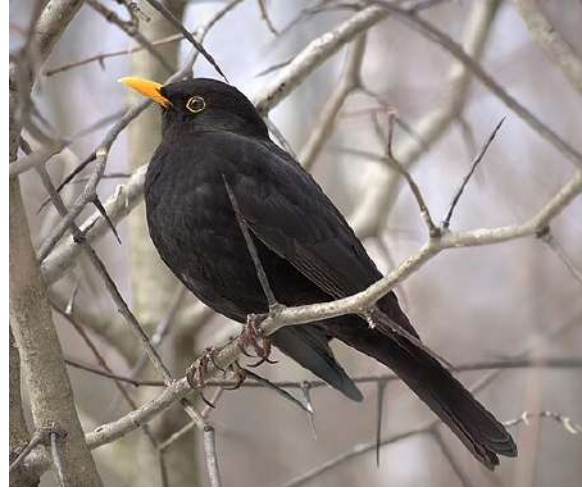
Corneille noire (cri très reconnaissable, rauque)