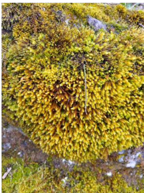
Anomodon viticulosus sur substrat rocheux à gauche, et ocelles rouges sur les feuilles de Frullania tamarisci à droite.