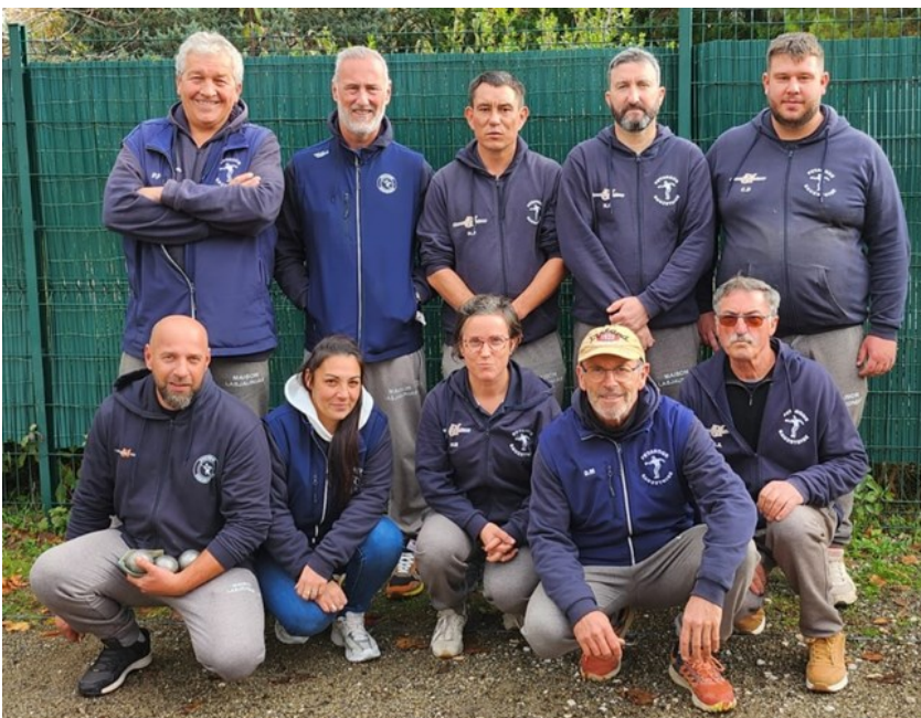
(L'équipe Sauzétoise qui a remporté la Coupe du Lot 2025)

Et enfin, au mois de novembre, c'est notre équipe de coupe qui a fait parler d'elle dans les journaux.