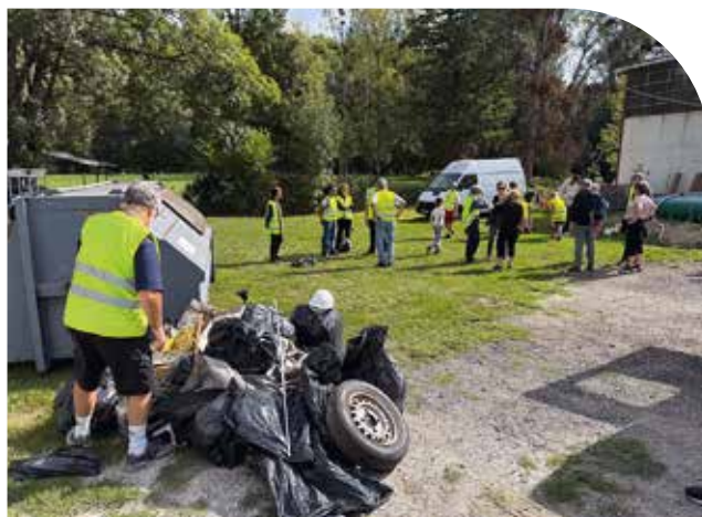
Les déchets collectés