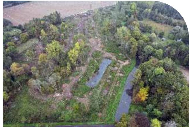
Étude pour la restauration d'une zone humide – La Motte Valencisse

En parallèle, de nombreuses actions d'animations et de sensibilisation sont mises en place, que ce soit via l'équipe technique du syndicat, ou via nos partenaires techniques.