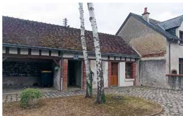
Dans la commune déléguée de Molineuf : Sous le préau, place de la Mairie à côté des WC publics.