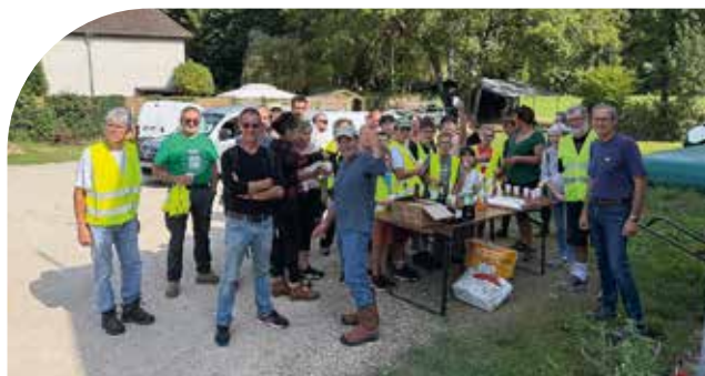
Une partie des participants à la journée écocitoyenne de Valencisse

Occasion aussi, pour les participants, d'une balade très appréciée dans les 3 villages.