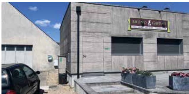
Dans la commune déléguée d'Orchaise : Derrière la salle Polyvalente à côté de la Boulangerie Gaveau.

➤ Trois défibrillateurs sont maintenant à votre disposition dans chacun de nos villages.