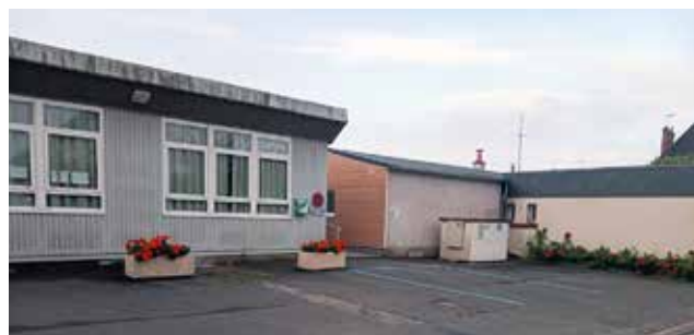
Dans la commune déléguée de Chambon-sur-Cisse : Sur le mur de la Salle des fêtes devant la place handicapé.