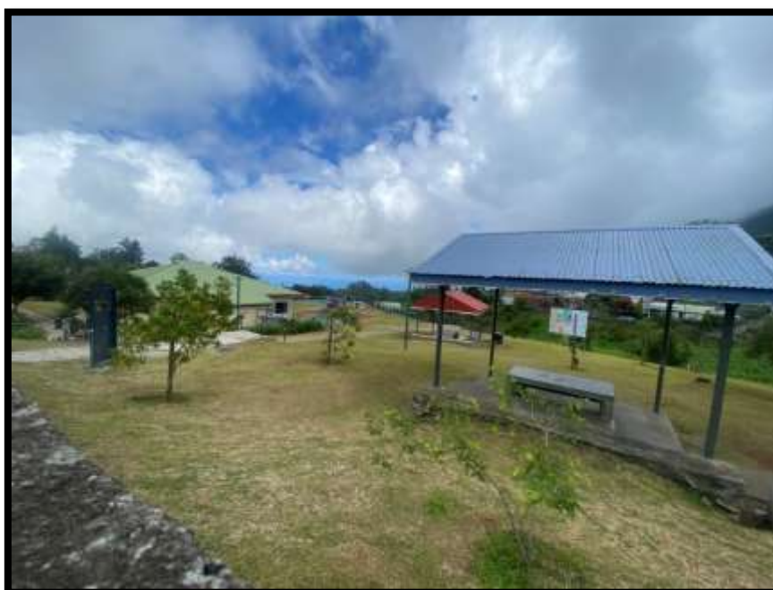
Aire de jeux et pique-nique