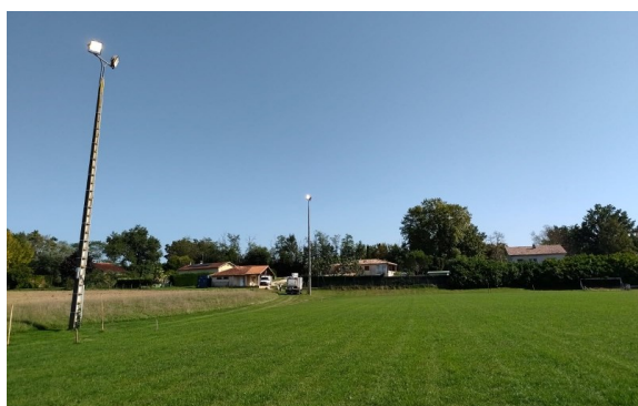
Réfection du terrain de foot de Lunel (pelouse, éclairage, cages, rambarde sécurité)