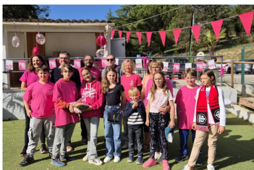
Octobre Rose p.16