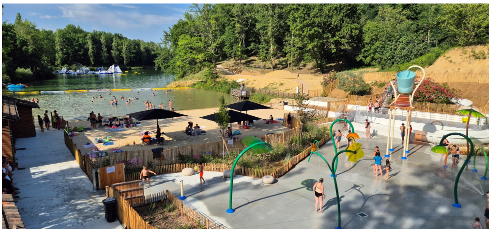
Travaux Vallée des loisirs (phase 2) : création d'un espace aquatique (jeux d'eau, toboggan), agrandissement de la plage, création de cheminement doux et sécurisé, d'un mur d'escalade, réfection des vestiaires du personnel... Coût : 1 008 900 €

Des travaux inscrits au budget ont été réalisés depuis 6 mois. Effectués en régie ou par des entreprises, ils visent à améliorer notre quotidien et à préserver notre patrimoine. En voici quelques-uns ( montants totaux en TTC ).