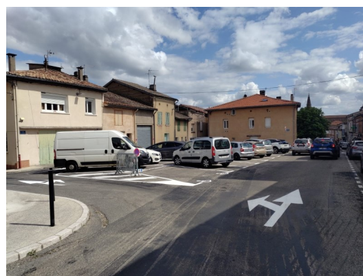
Traçage peinture routière dans le bourg