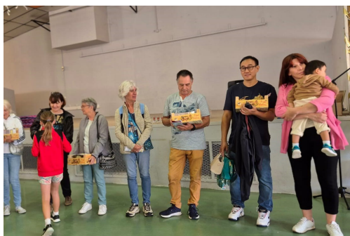
Forum des associations p.12