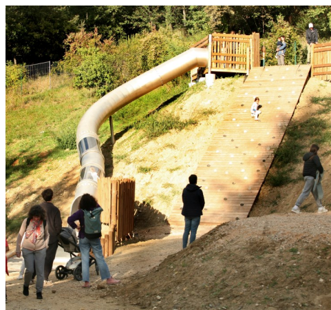
Création d'un toboggan sec et d'un mur d'escalade