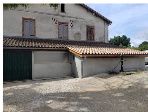
Création d'un local frigo à la maison de la chasse Coût : 9 736 €