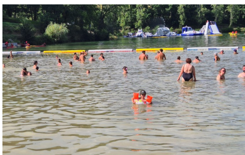
Bilan de la saison touristique p.22