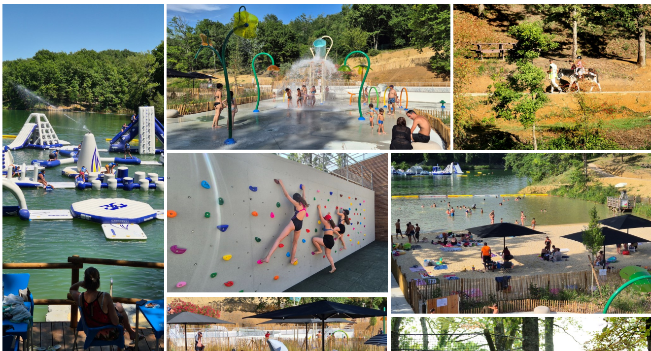
Un été en photos

Les commerces ont également ressenti les effets de la dynamique du site. C'est donc un bilan très positif qui nous conforte dans le choix des investissements faits.