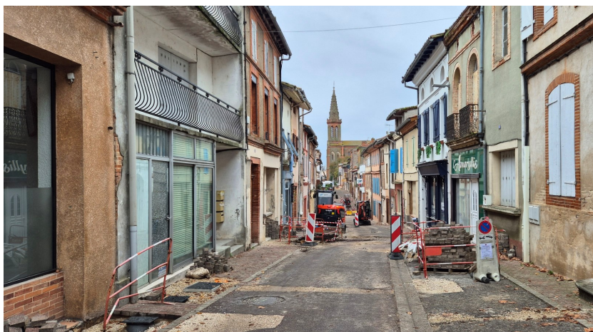
Végétalisation en pleine terre et réfection de la rue et des stationnements rue Louis Pernon Coût : 100 695 €