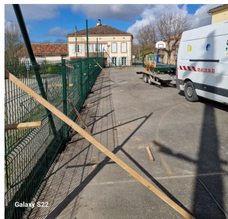
Remplacement de la clôture de l'école Jean Baylet Coût : 10 284 €