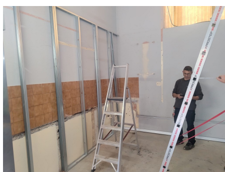
Réhabilitation de la cuisine de la salle des fêtes en régie Coût : 5 809 €