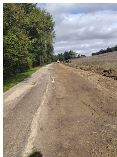
Travaux et entretien voirie (chemin de Combe Bonnet, de Poppis, de Raynaud....) Coût : 79 000 €