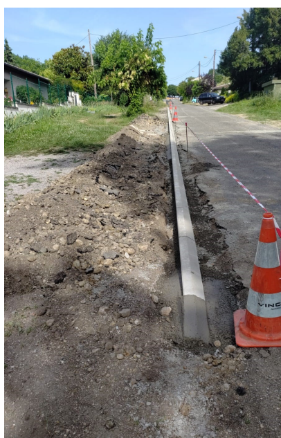
Création de bordures avenue Gouges Boutal Coût : 3 300 €