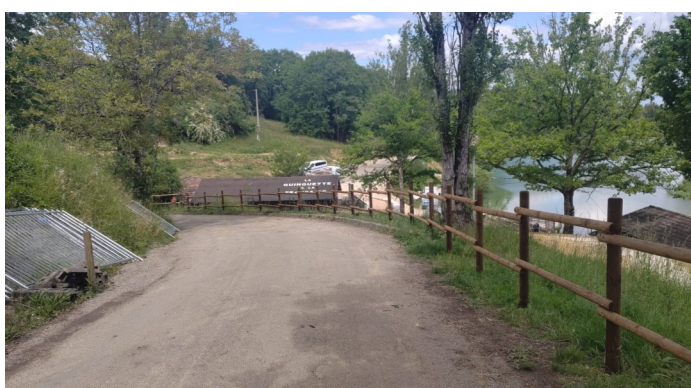
Création de rambarde de sécurité, de la terrasse de l'aqua-park et autres à la Vallée des Loisirs en régie Coût : 20 800 €