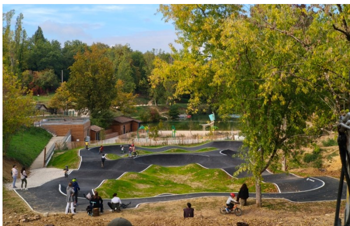
Création d'un pumptrack