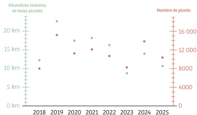
RÉPARTITION DES PLANTATIONS DE HAIES ENTRE 2018 ET 2025

Depuis 2018, ce dispositif d'accompagnement a permis la réalisation de 291 chantiers pour un total de 120.4 kilomètres de haies plantés. Ces opérations ont pour but de renforcer le maillage bocager du Parc et Géoparc, qui a réduit de moitié depuis 1945. Pour voir l'évolution du bocage, vous pouvez consulter l'observatoire en ligne : www.parc-naturel-normandie-maine.fr/evolution-bocage.html