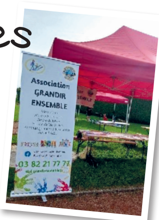
Forum des associations le 3 septembre 2023

L'Espace de Vie Sociale de l'association Grandir Ensemble propose de nombreuses animations pour les familles et les jeunes sur le bassin de vie piennois. De nombreuses animations ont été proposées pour cette fin d'année 2023, voici un petit retour en images :