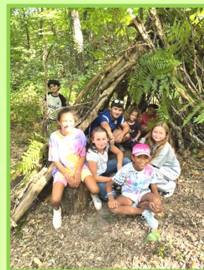
Cabanes en forêt