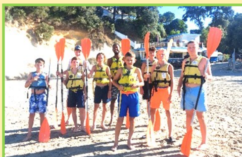
En route pour le kayak en mer