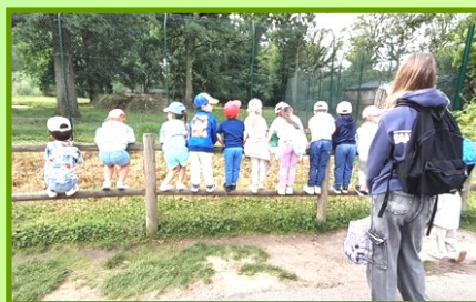
Visite du zoo d'Attilly