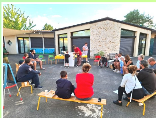
Veillée "Apéro" ouverte aux parents, un moment agréable passé tous ensemble en dehors des heures traditionnelles.