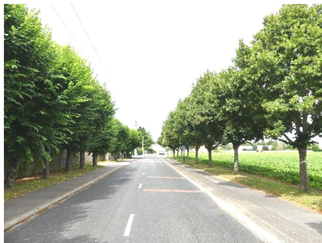
Portail du cimetière de 1866 et alignement d'arbres marquant son emplacement

Le nouveau cimetière est accessible par un portail monumental. Constitué de deux piles en pierre, il permettait aux corbillards d'accéder à l'enclos funéraire.