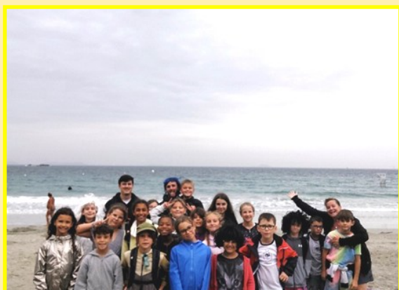
Plage de Trestrignel (mardi / jeudi)