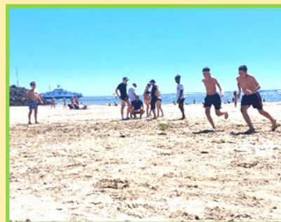
Football sur la plage avec un autre service jeunesse

Les jeunes du service jeunesse de Champcueil (SJC) sont partis pour la première fois en été, en séjour à la mer. Pour cette première expérience, plusieurs activités ont été proposées comme de l'initiation au paddle et au kayak en mer. Ces deux activités sportives ont été riches en découvertes mais aussi en fous rires et appréhensions pour certains. Ces 16 jeunes ont été encadrés par deux animateurs et un directeur.