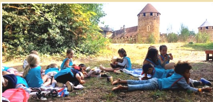
Temps calme pour les maternels et Moustache avec vue sur le château