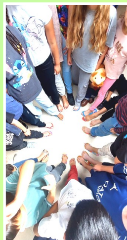
Lancé de tongs (faites maison)