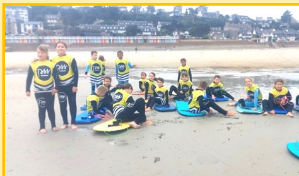
Initiation surf et bodyboard sur la place de Trestraou

Vingt enfants accompagnés de deux animateurs et un directeur ont pu apprécier les plages bretonnes de Perros Guirec. Au programme, découverte du surf et du bodyboard, jeux de plage, baignade, veillées tous les soirs pour le plus grand plaisir des enfants. Une semaine riche en découvertes, rires et émotions.