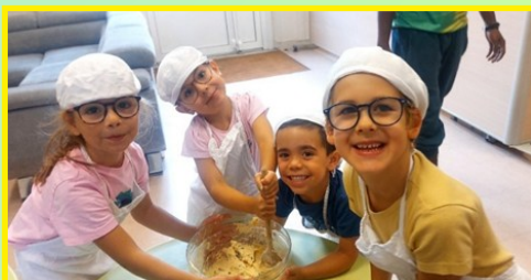
Atelier pâtisserie avec les maternels : confection de cookies