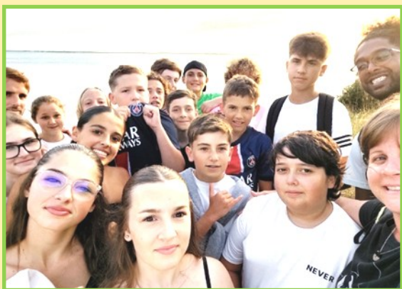
1 ère veillée : feux d'artifice de Royan