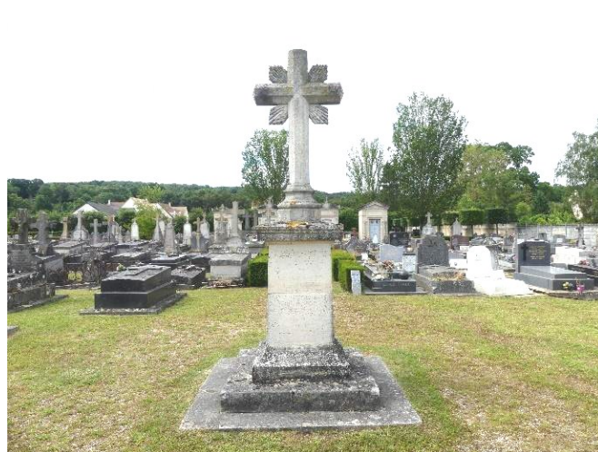
La croix du cimetière

Le cimetière a été l'un des premiers à être totalement engazonné dès 2015, par nos services techniques.