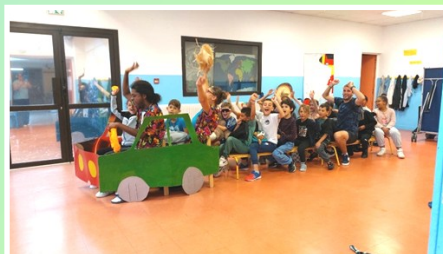
Voyage en bus.

Un programme rempli d'une multitude d'activités et jeux en tous genres. Les enfants et Moustache ont utilisé plusieurs moyens de transports durant le mois de juillet pour découvrir le monde (voiture, bus, train, bateau, avion et fusée). Et lors du mois d'août, le voyage dans le temps les a transportés à la Préhistoire, à l'Antiquité et au Moyen âge.