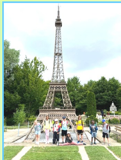
Visite de France Miniature