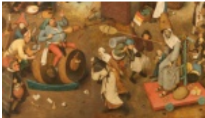
Le combat de Carnaval et Carême Pieter Brueghel l'Ancien – 1559

Mardi-Gras marque l'entrée en Carême. Cette année, Carême commencera le mercredi 18 février pour se terminer, comme le veut la tradition, le 02 avril, quelques jours avant le dimanche de Pâques. Institué par les Chrétiens dès le IVème siècle, il dure 40 jours, d'où son nom en latin « Quadragesima ». Ce temps de jeûne est considéré comme préparant à la purification et la méditation.