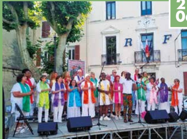
▶ La fête de la musique