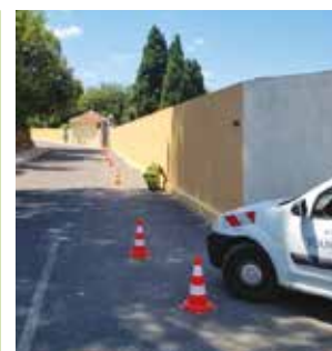
► Peinture cimetière