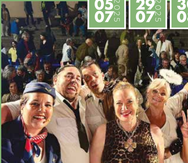
▶ Spectacle de Mounte Venen « Promis, juré, crashé »