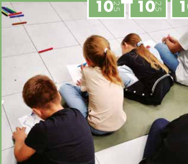
► Semaine d'information sur la santé mentale