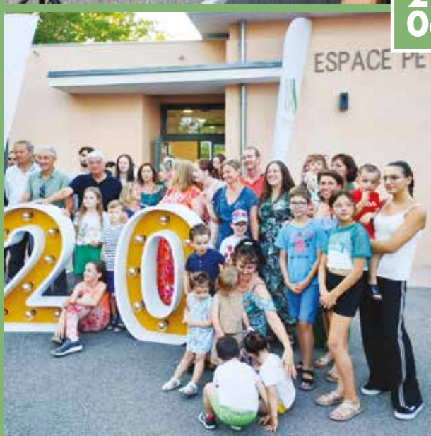
▶ Les 20 ans de la crèche «L'Île aux enfants»