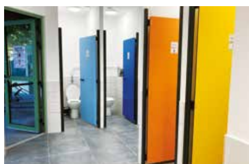
► Bloc sanitaire de l'École élémentaire