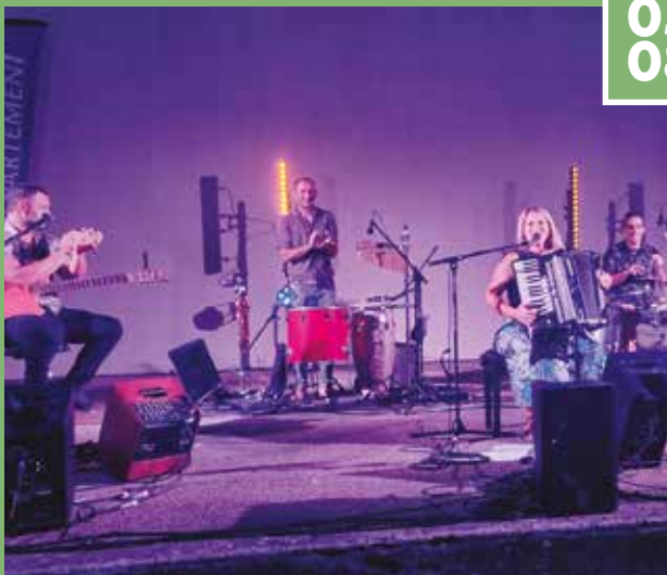
▶ Voix départementales du Var