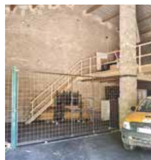
► Remise Grisolle