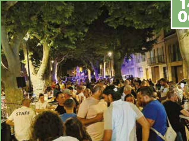
▶ Les Halles Gourmandes ACAPLTE