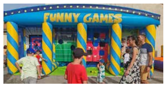
Kermesse de l'école