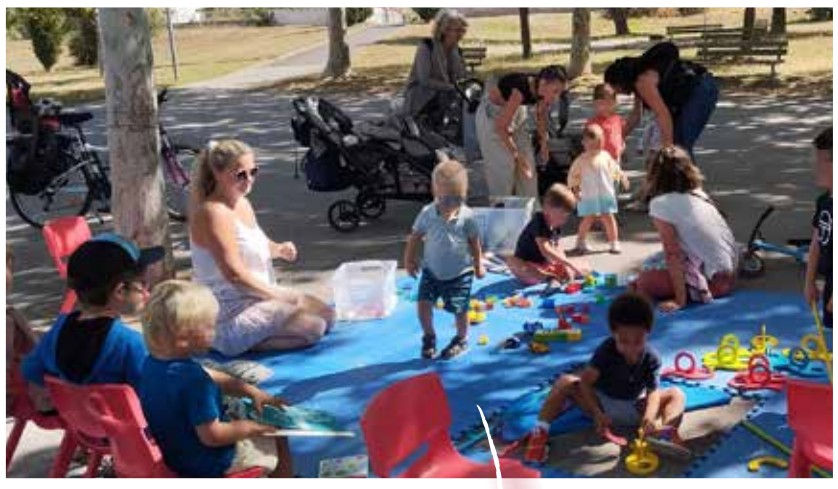
Mercredis du square