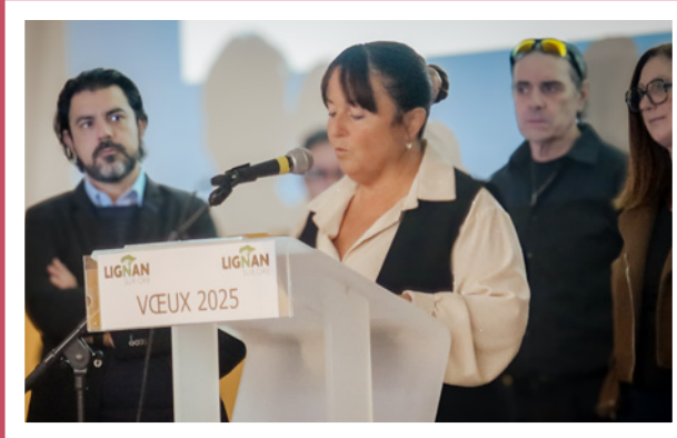
Vœux de Mme le Maire à la population