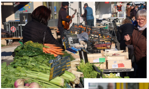
Marché de Lignan tous les dimanches