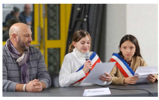
Le Conseil Municipal des enfants et des jeunes invité au conseil municipal