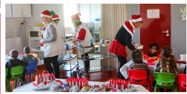
Noël à la cantine scolaire