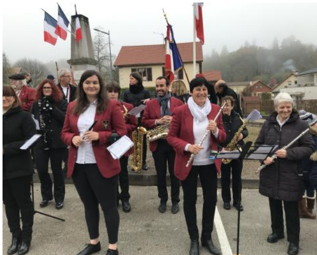
L'harmonie des Chaprais

Le 11 novembre 2021 , les Thisiens, jeunes et moins jeunes, après un contexte sanitaire peu propice aux commémorations publiques, se sont massivement rassemblés autour du monument aux morts, soulignant ainsi leur attachement fort au devoir de mémoire et aux valeurs patriotiques, pour entonner la Marseillaise impulsée par les élèves des écoles de Thise.