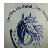
Refuge « Un rêve, un cheval, une famille »