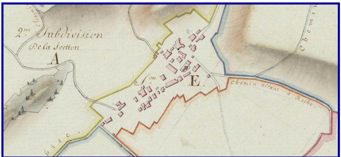
Cadastré parcellaire dit « napoléonien » – détail du plan linéaire de la commune de Thise (Date : 1808, cote : 3P561, Archives départementales du Doubs)