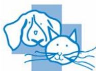
Clinique vétérinaire des Tilleroyes