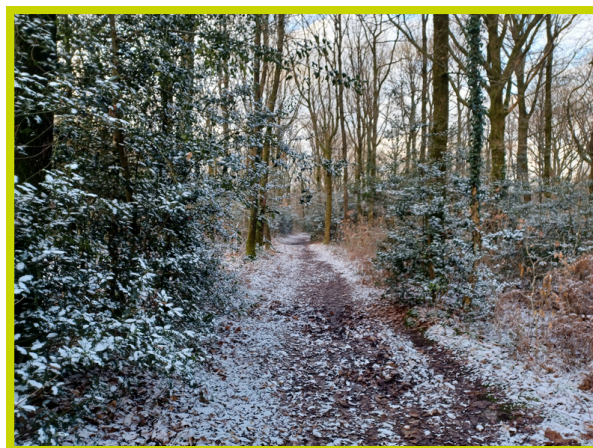
La forêt enneigée le 25 décembre

12h30 : Cheffois Antigny STM 3 / D4 à Cheffois