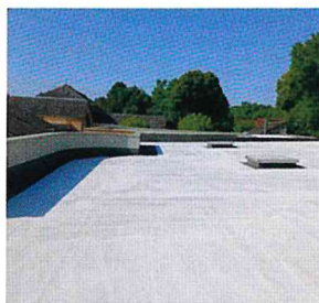
Les toitures des bâtiments communaux ont été repeintes.

Un système rafraîchissant pour les toits communaux, c'était une véritable attente pour Gilbert Blanc, le maire. C'est désormais chose faite, car la commune a opté pour une technique venue des États-Unis : le « cool roofing » (ou « toit frais »). Cette démarche, qui concerne le traitement des 530 m 2 de toits plats des bâtiments communaux, s'inscrit dans une démarche écologique, économique et de bien-être pour les usagers des infrastructures municipales. « Le cool roof est une toiture de couleur blanche conçue pour renvoyer la chaleur solaire dans l'espace, ce qui minimise l'échauffement du bâtiment, explique Gilbert Blanc. Une toiture blanche emmagasine dix fois moins de chaleur qu'une toiture sombre. Ce concept est appliqué avec efficacité depuis longtemps dans les pays chauds, comme la Grèce ou les pays du Maghreb. »