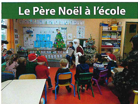
Le Père Noël à l'école