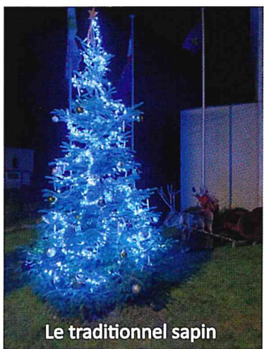
Le traditionnel sapin