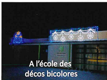
A l'école des décors bicolores