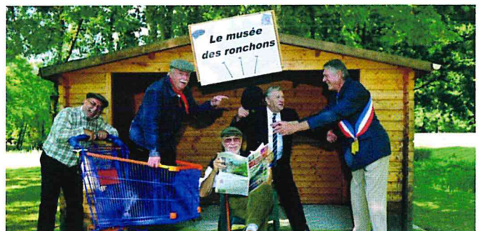
Les Ronchons lisent La Nouvelle République.