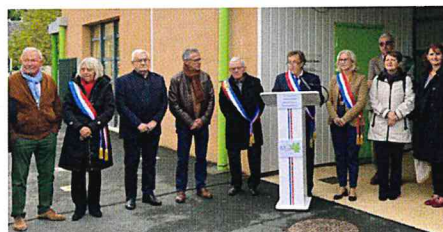
L'inauguration à plusieurs volets a rassemblé de nombreux invités.