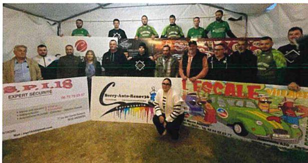
Le club a été rejoint par de nouveaux partenaires.

Quand on est promu, il faut prendre ses marques et les trois