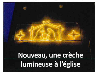
Nouveau, une crèche lumineuse à l'église