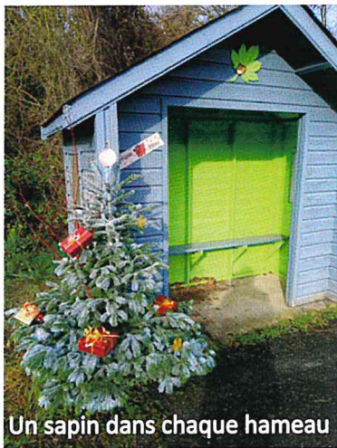
Un sapin dans chaque hameau