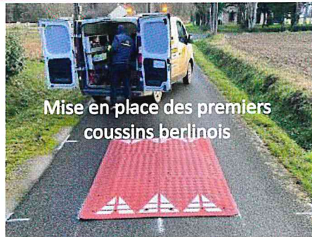
Mise en place des premiers coussins berlinois