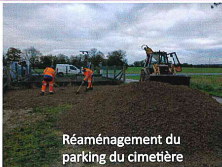
Réaménagement du parking du cimetière