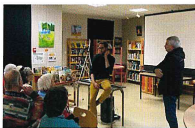
Après le documentaire, l'après-midi s'est poursuivi par un débat.