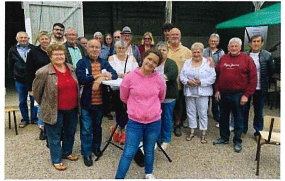
Les membres de l'association ont dressé les bilans.