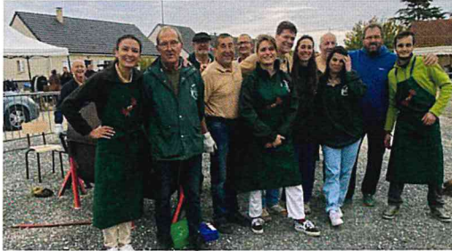
Au stand des châtaignes grillées la bonne humeur était de rigueur.

en avait pour tous les goûts. Enfin, la Fête du marron c'est aussi la rencontre avec le folklore matérialisé par la présence des Bordins de l'Arnon et la musique entraînante et festive proposée par Les Diablotins sévérois.