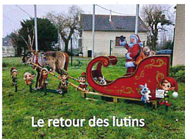
Le retour des lutins