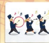
MANSONVILLE MUSIQUE MILITAIRE