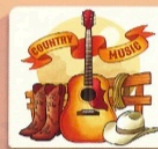
CASTET ARROUY COUNTRY