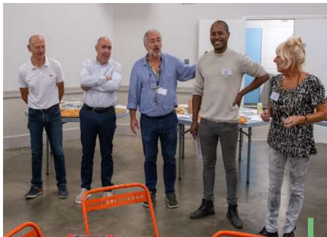
Les organisateurs du RCPSL accompagnés des maires de Sainte-Croix et Claret

« Un an seulement après son lancement, le Repair Café du Pic Saint Loup est déjà une belle réussite collective et une aventure humaine qui ne demande qu'à grandir », ont résumé les organisateurs.