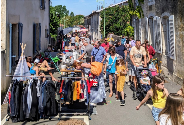
Une foule à la recherche de bonnes affaires... ou tout simplement pour se promener.

Le dimanche 12 Mai a eu lieu la brocante dans les rues de Chaudeney. Plus de 80 exposants ont pu ainsi prendre possession des rues Émile MOSELY et du Colombier pour y installer leur stand rempli de trésors pour les futurs badauds.