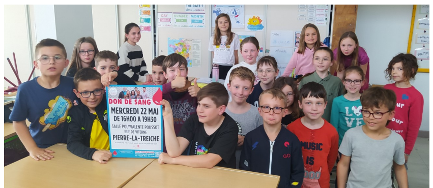
Des élèves studieux et attentifs.

Les bénévoles de l'Association des Donneurs de Sang de la Boucle de la Moselle (ADSBM) vont encore intervenir à l'école de Dommartin avant les vacances afin d'assurer la promotion du don du sang, encourager ceux qui ont déjà donné à donner encore et inciter de nouveaux donateurs à sauter le pas.