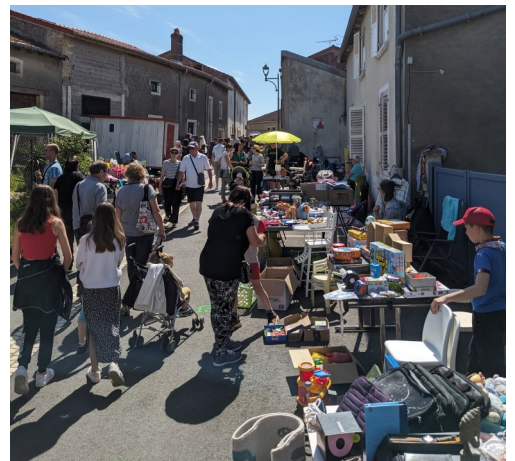
La brocante sous le soleil