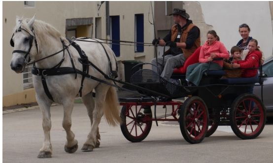
Balade en calèche dans les rues du village.