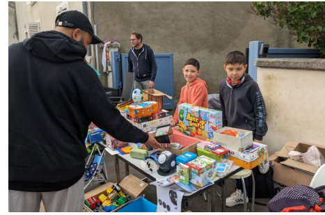
On fait de la place pour de nouveaux jouets ?