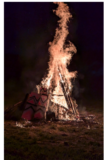
Clôture de la soirée avec l'embrasement du tipi.