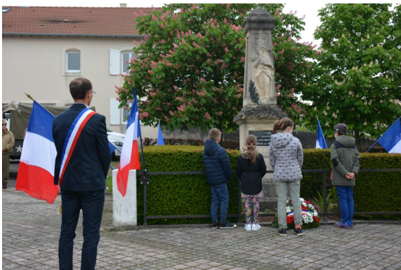
Moment de recueillement avec la minute de silence.

De nombreux habitants du village ont donc répondu présents devant le monument aux morts face à la mairie afin de rendre hommage à ceux qui se sont battus pour notre liberté et contre les atrocités commises par le régime nazi.