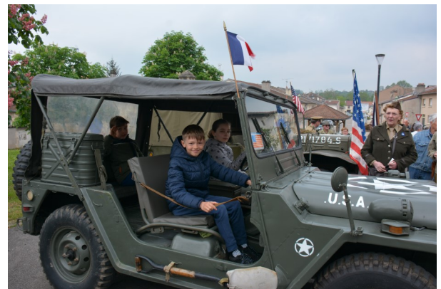
Découverte des véhicules de l'armée américaine.