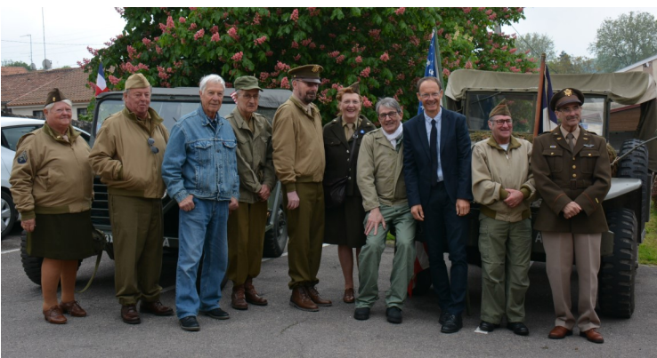
Des passionnés présents chaque année.

Cette cérémonie a été également l'occasion pour un jeune public de découvrir au plus près les véhicules militaires qui furent utilisés à l'époque. Un grand merci aux membres de ce club de passionnés qui chaque année, fidèles au rendez-vous, nous font découvrir les uniformes et véhicules utilisés il y a 80 ans.