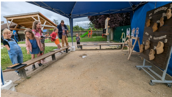
Les jeux de tir et d'adresse ont eu du succès.

Puis vint le spectacle de hip-hop proposé par Ludwig avec plusieurs danses rythmées pour le plaisir des spectateurs. La MJC a ensuite offert le goûter pendant lequel plusieurs stands de jeux de tir et d’adresse étaient mis à disposition des curieux. Des balades en calèche ont été proposées pour le plus grand bonheur des enfants ainsi que des présentations de dressage de chiens. Les cours de relaxation et une nouveauté pour l’année prochaine - à savoir couture - étaient également représentés.