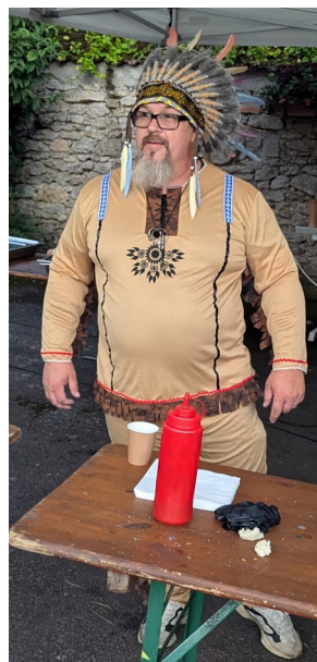
Y a-t-il eu du bison servi à la restauration ?