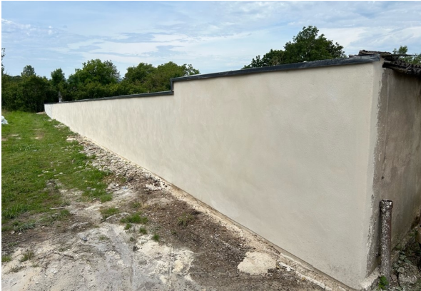
Poursuite de la réfection du mur du cimetière.