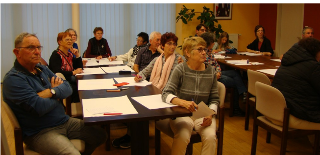
Un auditoire attentif.

Prochaine manifestation de la Médiathèque : « Le Livre sur la plage » qui aura lieu le vendredi 19 juillet à partir de 17h00 Place de la Mairie sous les marronniers.