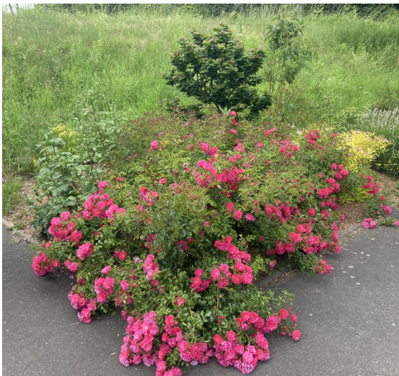
Fleurissement du village