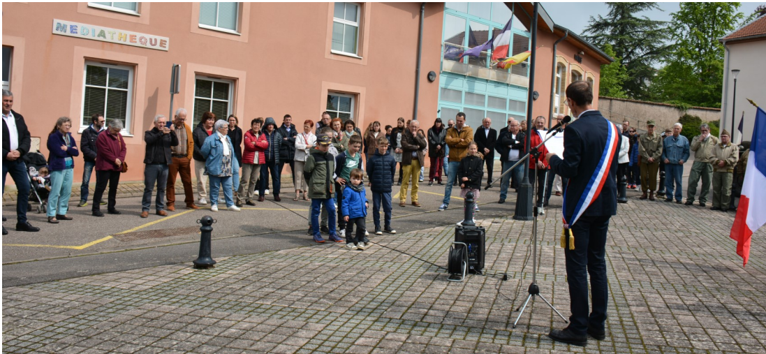
Les habitants nombreux à ce rendez-vous important du souvenir.

Ces dernières années, la commémoration de l'anniversaire de la victoire du 8 mai 1945 ne cesse de prendre de l'ampleur de par son rôle du souvenir au regard des conflits actuellement en cours au niveau international et surtout, toujours présents aux portes de l'Europe.