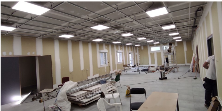
Maurice BOUCHOT : La grande salle en travaux