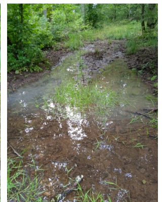
Des chemins difficilement praticables pour les affouages.

Il est donc plus raisonnable d'attendre de meilleures conditions climatiques afin de préserver les sols et la sécurité des personnes.