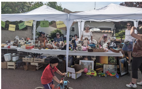
Des stands biens remplis.

Sous un soleil des plus apprécié car absent depuis longtemps, exposants et visiteurs ont pu se retrouver le temps de midi autour de la buvette pour se restaurer. Ce fut une belle journée remplie de rencontres et de marchandages, où chacun a pu partir heureux. Pour l'un avec une nouvelle acquisition à bon prix et pour l'autre avec de la place en plus à la maison !