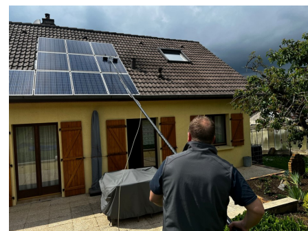
Nettoyage de panneaux solaires.

Visitez notre site : https://www.skytech-solutions.fr/