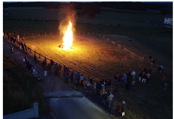
Feu de la St Jean en clôture de la MJC en fête