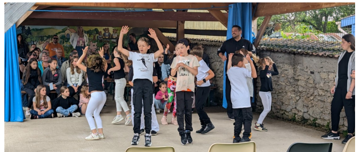
Ça bouge avec le spectacle de hip-hop.

Les festivités se sont poursuivies avec l’ouverture de la buvette et de la restauration. Président de la MJC et bénévoles respectivement vêtus de costumes de cow-boy et d’indien ont ensuite mené les participants au terrain de foot pour assister à l’embrasement du tipi. Souhaitons que le soleil ait eu vent de ce rituel du feu de joie et soit plus présent dans le ciel caldénicien.