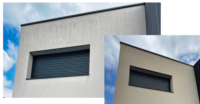
Nettoyage de façade, avant et après.