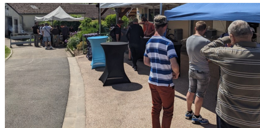
Le point restauration, toujours assuré par une équipe dynamique.