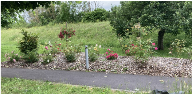
Une entrée de village fleurie