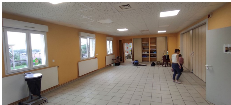
Cantine, finition du nettoyage par « la Souris Verte ».

À l'intérieur, dans la grande salle et le nouveau local de rangement, le carrelage, les menuiseries, les cloisons sont posés. Le remplacement des plafonds avec l'isolation est en voie d'achèvement. La nouvelle installation électrique et l'éclairage sont fonctionnels. Il reste des finitions avant l'intervention des peintres.