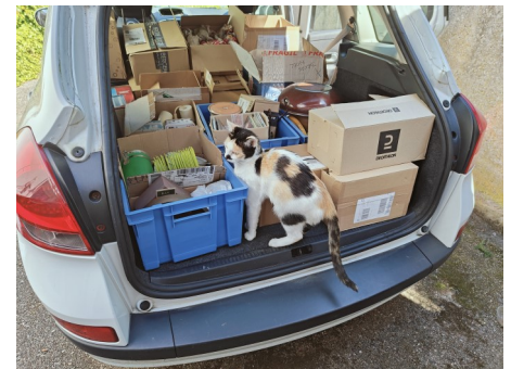
On optimise le transport pour les objets (et non le chat) à vendre.

Sous un soleil des plus apprécié car absent depuis longtemps, exposants et visiteurs ont pu se retrouver le temps de midi autour de la buvette pour se restaurer. Ce fut une belle journée remplie de rencontres et de marchandages, où chacun a pu partir heureux. Pour l'un avec une nouvelle acquisition à bon prix et pour l'autre avec de la place en plus à la maison !