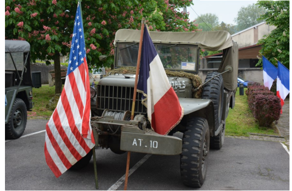
Cérémonie de la commémoration du 79ème anniversaire de la victoire du 8 mai 1945