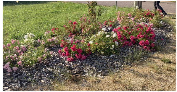
Des plants adaptés pour durer plusieurs années en diminuant l'entretien.