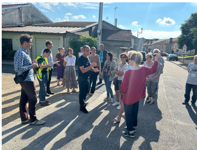
Un échange constructif avec les habitants pour recenser les besoins et attentes de ce projet.

De nombreux habitants ont participé à cette balade collective et contribué activement à façonner l'avenir de la commune.