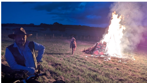
Pas de danse de la pluie autour du feu, c'est promis.

Les festivités se sont poursuivies avec l’ouverture de la buvette et de la restauration. Président de la MJC et bénévoles respectivement vêtus de costumes de cow-boy et d’indien ont ensuite mené les participants au terrain de foot pour assister à l’embrasement du tipi. Souhaitons que le soleil ait eu vent de ce rituel du feu de joie et soit plus présent dans le ciel caldénicien.