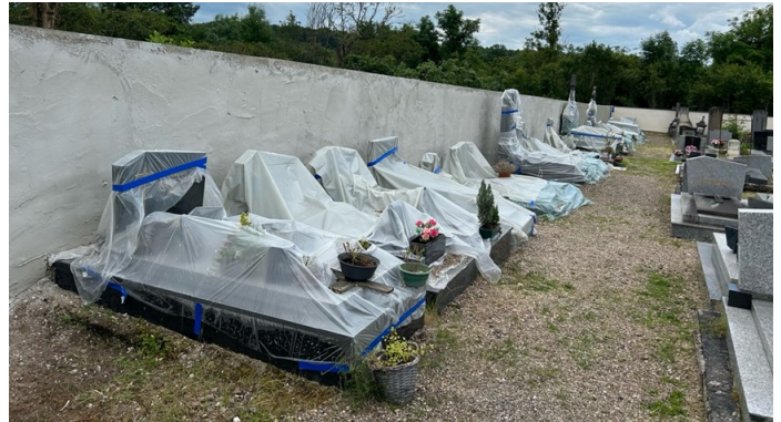
Un soin particulier a été apporté à la protection des tombes.

L'année prochaine verra la continuité et la fin des travaux.