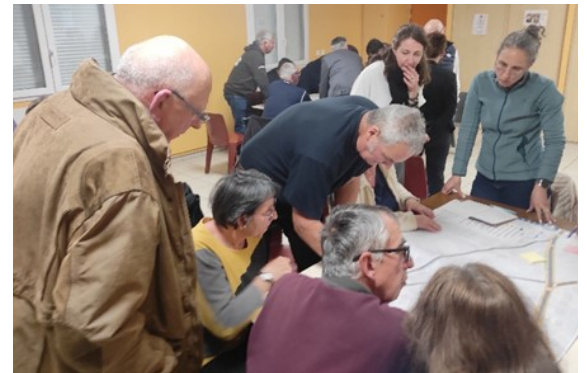
Les idées et remarques sont exprimées pour faire évoluer le projet