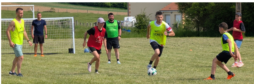
Tournoi de football en haut du village

Après les efforts du matin, place au réconfort ! Les participants se sont retrouvés autour d'un barbecue en libre service pour une pause méridienne grandement méritée. Les animations ont repris de plus belle l'après-midi, laissant place à des rencontres disputées de football et de volley-ball. En fil rouge tout au long de l'événement, de grands jeux en bois ont également fait le bonheur des petits et des grands, donnant lieu à de magnifiques défis intergénérationnels.