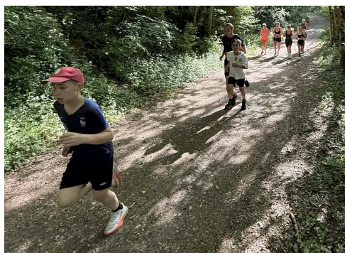
Course dans les bois qui n'est pas sans rappeler la Caldé

Les festivités ont démarré dès 9h00 par un réveil musculaire collectif, idéal pour lancer une matinée particulièrement rythmée. Randonneurs, coureurs, traileurs en VTT, amateurs de pétanque et adeptes du ballon orange se sont ainsi succédés dans une ambiance chaleureuse.