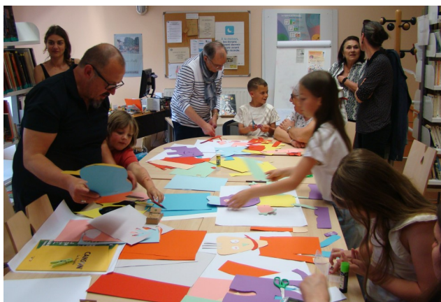
Conception de personnages articulés