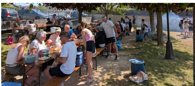
Une pause bien méritée avant la reprise des activités

Les festivités ont démarré dès 9h00 par un réveil musculaire collectif, idéal pour lancer une matinée particulièrement rythmée. Randonneurs, coureurs, traileurs en VTT, amateurs de pétanque et adeptes du ballon orange se sont ainsi succédés dans une ambiance chaleureuse.