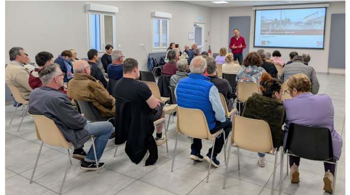
Présentation de l'avant-projet sommaire

Le 19 mai, la rencontre de concertation a réuni une quarantaine de personnes dont une majorité de riverains. A partir de plans et de plusieurs options d'aménagement de l'avant-projet sommaire, un atelier participatif a été réparti en quatre groupes qui ont débattu et restitué leurs propositions à l'ensemble des présents.