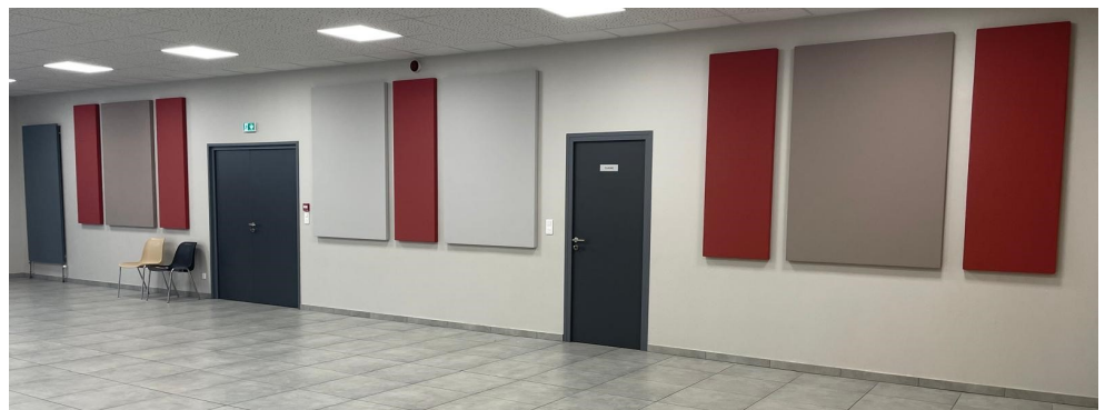
Côté entrée et cuisine

Afin d'améliorer le confort sonore à la salle Maurice Bouchot, nous avons installé des panneaux d'absorption acoustique.