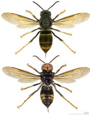
Le frelon asiatique est bien plus sombre que le frelon européen

⇒ diamètre. Dans 80% des cas, il est aérien, le plus souvent situé dans des arbres à plusieurs mètres de hauteur. Dans 20% des cas, on le trouve à faible altitude : au ras du sol, sous une charpente ou dans des cheminées. La destruction de ces nids est réglementée.