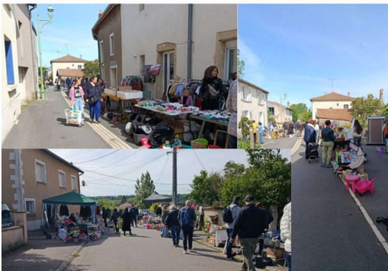
Dimanche estival pour la brocante

Cette édition 2026 confirme une fois encore l'attachement de tous à cet événement incontournable de la vie locale. Un grand merci aux bénévoles, aux exposants et aux visiteurs qui ont contribué à la réussite de cette belle journée.