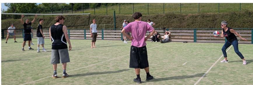
Tournoi de volley-ball au city stade

Pour clore en beauté ce rassemblement baigné de soleil, l'association a offert un planteur maison à l'ensemble des convives. Une délicieuse manière de faire durer les échanges et de célébrer la réussite de cet événement profondément fédérateur.