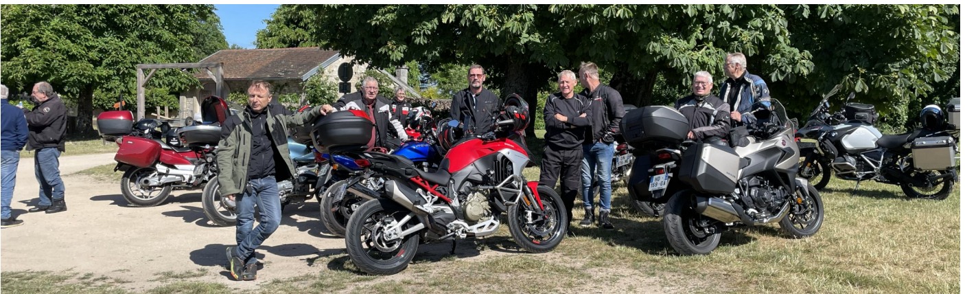
Balade à moto sur les routes de Meuse

Le 6 juin 2026 a été organisé pour la 12 ème année une balade par le club Sans Club de Moto de Chaudey-sur-Moselle. Une douzaine de motos s'était donnée rendez-vous pour 8h30 salle Maurice BOUCHOT pour un départ à 9h00.