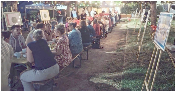
La soirée s'est achevée autour d'un repas préparé par l'équipe salariée.