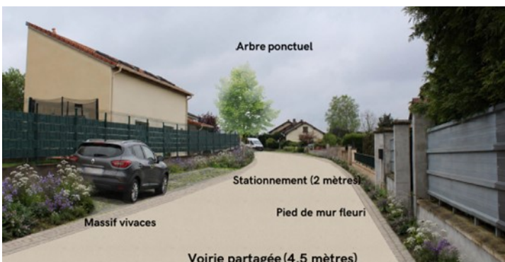
Simulation basée sur l'avant-projet sommaire

Suite à ce travail collectif, une restitution sera programmée courant octobre.