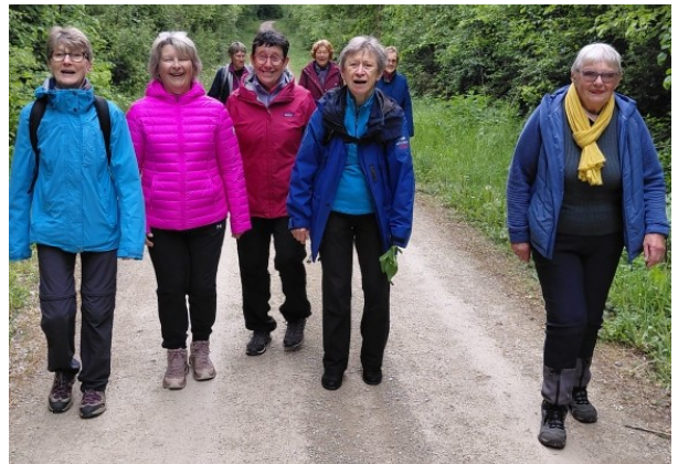
Une petite marche pour se mettre en appétit

À noter que le CEPA propose à la salle Maurice BOUCHOT deux séances de gymnastique par semaine de 9h30 à 10h30, les mardis et jeudis.