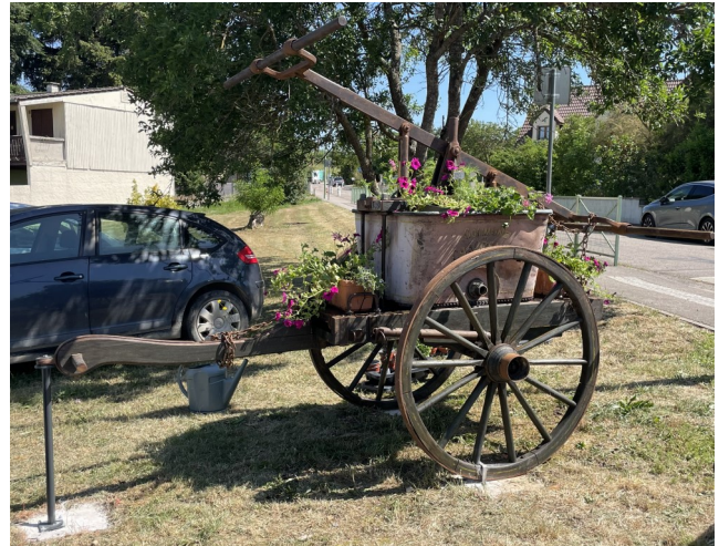
La pompe désormais fleurie est visible par tous