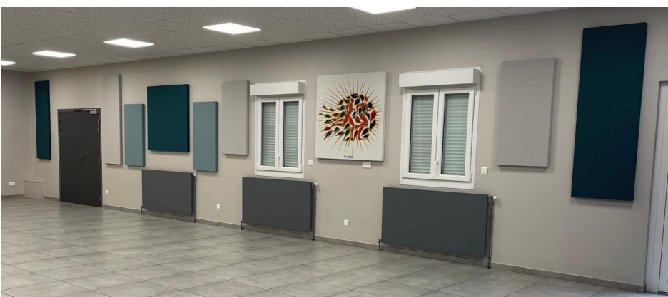
Côté rue de l'église

De plus, les formes et les couleurs de ces panneaux deviennent des éléments de décoration qui embellissent la salle.