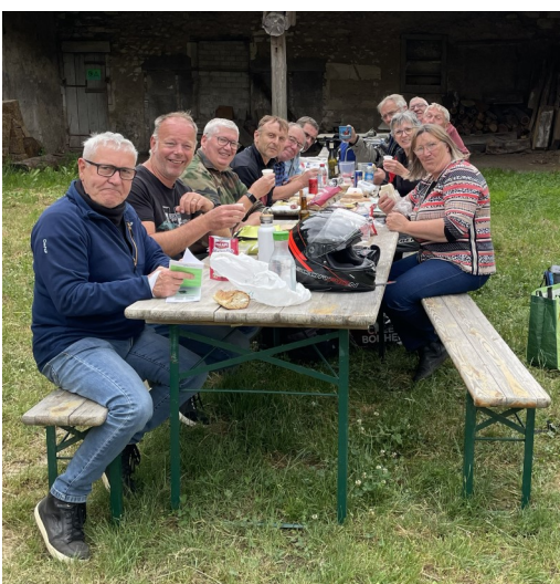
Pause déjeuner au bar associatif « Le Vent des Forêts »