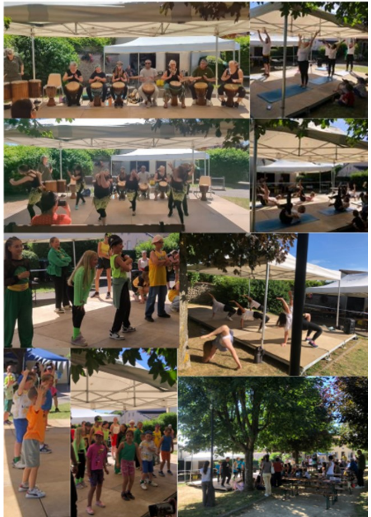
De nombreuses représentations ont ponctué cette journée

Au-delà des démonstrations, cette fête a rappelé le rôle essentiel que joue la MJC dans la vie de notre village. Grâce à ses nombreuses activités sportives, musicales et culturelles, elle contribue tout au long de l'année à créer du lien entre les habitants et à faire vivre notre commune. Gageons que toutes ces activités perdureront encore l'année prochaine et accueilleront toujours plus de participants. Car si la MJC vit grâce à ses adhérents, elle a également besoin de celles et ceux qui s'investissent pour faire vivre et animer les différentes activités proposées.