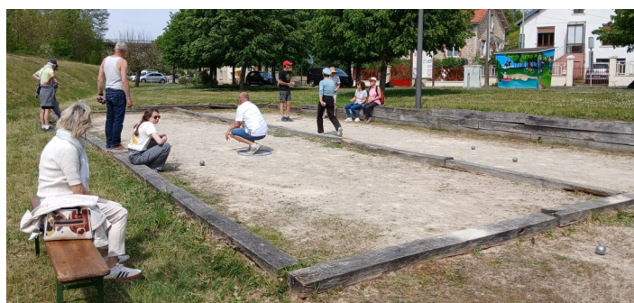
Tournoi de pétanque place Maurice Carême

Après les efforts du matin, place au réconfort ! Les participants se sont retrouvés autour d'un barbecue en libre service pour une pause méridienne grandement méritée. Les animations ont repris de plus belle l'après-midi, laissant place à des rencontres disputées de football et de volley-ball. En fil rouge tout au long de l'événement, de grands jeux en bois ont également fait le bonheur des petits et des grands, donnant lieu à de magnifiques défis intergénérationnels.