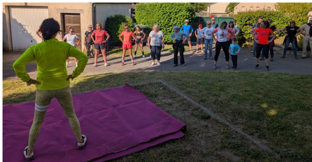
L'échauffement va commencer

Le samedi 2 mai, l'association Familles Rurales a fait vibrer la commune au rythme du sport et de la convivialité. Un seul mot d'ordre pour ce rendez-vous printanier : rassembler toutes les générations et tous les niveaux autour du plaisir de bouger ensemble !