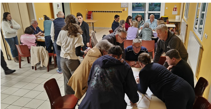
Une importante implication des riverains

Les travaux ont pour objectifs, l'embellissement, la qualité, la sécurité des déplacements. Les réseaux aériens seront enfouis, une partie du réseau d'eau sera renouvelé et renforcé. La totalité de la voirie sera réaménagée.