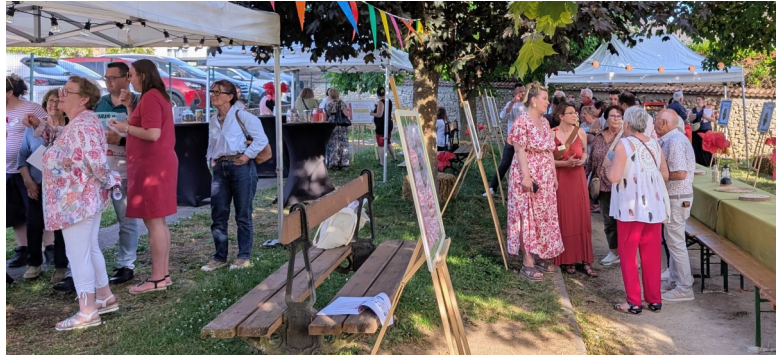
Moment d'échanges avant de démarrer les assemblées