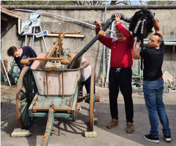
Nettoyage dans la bonne ambiance

Ensuite sont apparues les pompes à moteur qui ont remplacé rapidement ces engins ; ils ont été souvent détruits, certains ont pris place dans des musées ou dans les villages, comme maintenant à Chaudeney : elle trône à l'angle de la rue des Coquillottes et de la rue de la Fontaine. Un beau souvenir du passé !