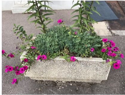
Vasques, jardinières, bacs ou massifs, tout est prêt pour embellir le village