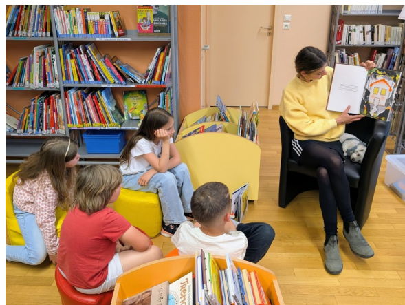
Lecture du conte « Dix de plus, dix de moins »