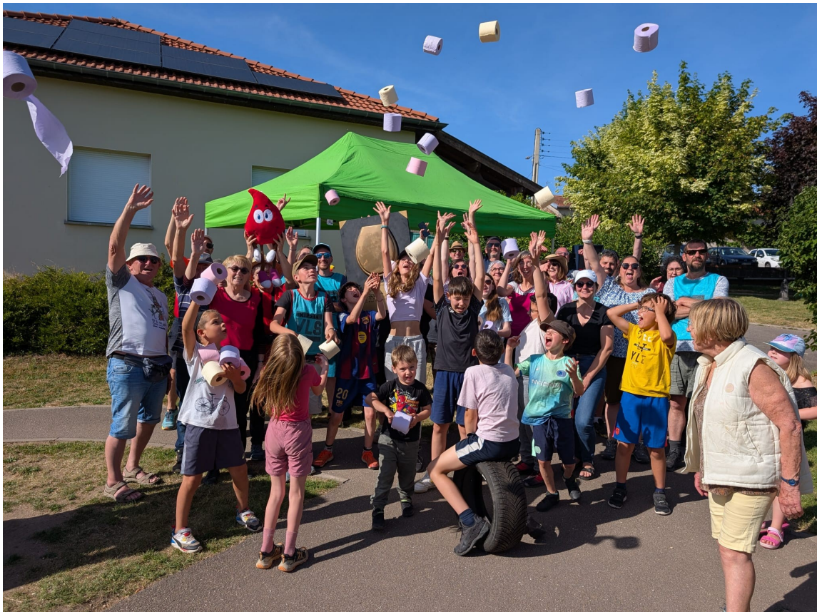
Et les vainqueurs des jeux intervillages sont...