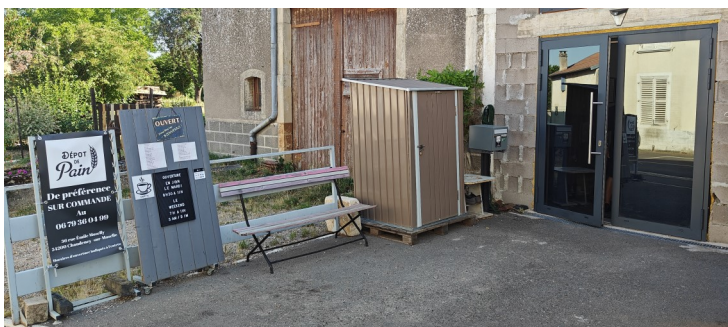
Le dépôt de pain est installé dans une ancienne grange

Le dépôt de pain est accessible actuellement le mardi de 8h30 à 11h et le week-end (samedi et dimanche) de 7h à 11h mais les horaires peuvent changer en fonction des disponibilités de Vincent (notre site internet en fera le relais). Avec encore des idées en tête, Vincent fera certainement évoluer ce nouveau lieu de vie dans un avenir proche.