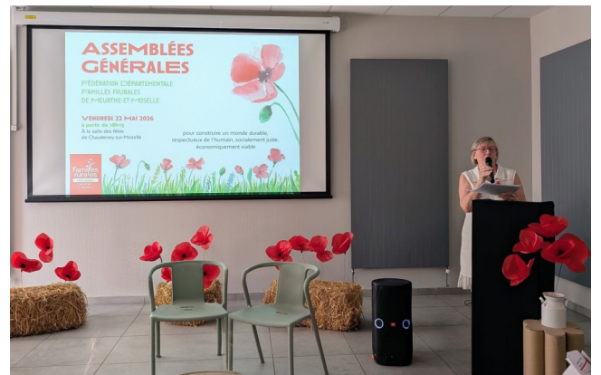
Le coquelicot, métaphore du mouvement