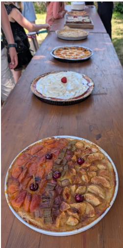
Concours de la meilleur tarte

Les organisateurs tiennent à remercier les Caldéniaciens pour leur accueil et leur mobilisation ainsi que les élus de Villey-le-Sec et leurs homologues pour leurs mots d'encouragement. Merci aux sept associations ayant proposé des jeux pour animer cette journée : le Foyer Rural et la Société de tir de Villey-le-Sec, mais aussi Familles Rurales, la MJC de Chaudeney-sur-Moselle et Les P'tits Sotrés, qui accompagnent les trabecs en culottes courtes lors des temps scolaire et périscolaire, et enfin Les Sentiers des Deuilles, Les Donneurs de Sang de la Boucle de la Moselle et Cœur et Entretien Physique Adapté du Toulouais. Et évidemment un GRAND MERCI à l'ensemble des participants, sans qui les Jeux Intervillages manqueraient cruellement de bonne humeur et de mauvaise foi !