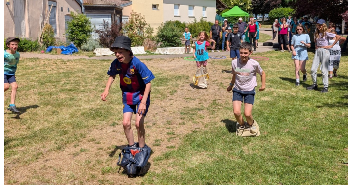
La course en sac revisitée

Les organisateurs tiennent à remercier les Caldéniaciens pour leur accueil et leur mobilisation ainsi que les élus de Villey-le-Sec et leurs homologues pour leurs mots d'encouragement. Merci aux sept associations ayant proposé des jeux pour animer cette journée : le Foyer Rural et la Société de tir de Villey-le-Sec, mais aussi Familles Rurales, la MJC de Chaudeney-sur-Moselle et Les P'tits Sotrés, qui accompagnent les trabecs en culottes courtes lors des temps scolaire et périscolaire, et enfin Les Sentiers des Deuilles, Les Donneurs de Sang de la Boucle de la Moselle et Cœur et Entretien Physique Adapté du Toulouais. Et évidemment un GRAND MERCI à l'ensemble des participants, sans qui les Jeux Intervillages manqueraient cruellement de bonne humeur et de mauvaise foi !