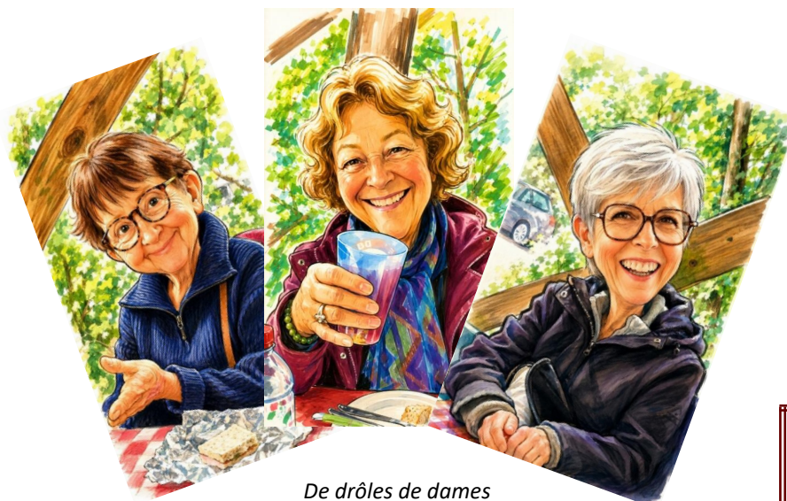
De drôles de dames

Merci à la municipalité pour la mise à disposition, à titre gracieux, de la salle des fêtes et à l'ACCA pour le prêt de la baraque de chasse.