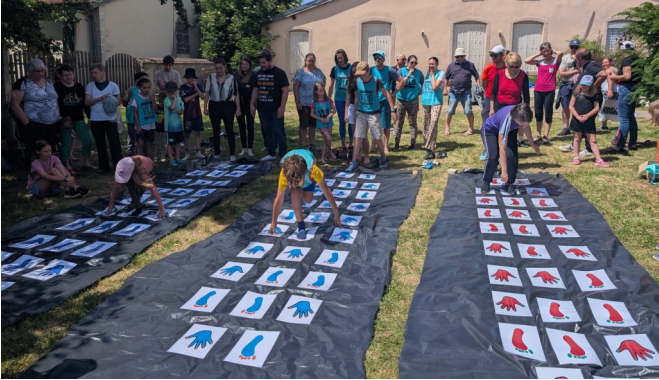
Équilibre et souplesse pour avancer

D imanche 7 juin à Chaudeney-sur-Moselle, une très belle édition des Jeux intervillages a une fois de plus réuni Trabecs, Pierrats et Caldéniaciens (1621 personnes selon les organisateurs, 72 selon les forces de l'ordre). Chacune des trois délégations a vaillamment défendu les couleurs de son village, affrontant des arbitres corrompus et des adversaires tricheurs. À ce jeu-là, c'est Chaudeney-sur-Moselle qui s'en est le mieux sorti cette année, gravant enfin son nom sur le trophée tant convoité.