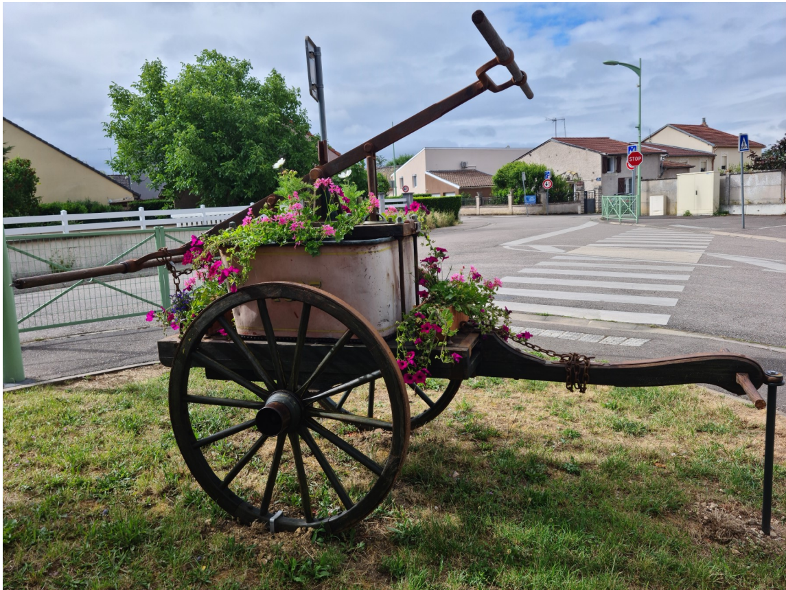
Une nouvelle vie pour la pompe à bras de 1897