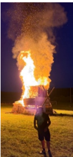
Vincent CLÉMENT après avoir embrasé le moulin

Rendez-vous l'année prochaine pour une nouvelle édition et de nouveaux moments de découverte, de rencontre et de plaisir partagé.