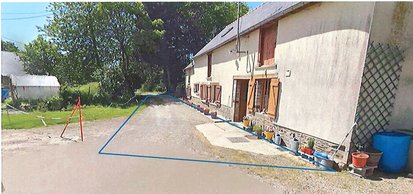
Tronçon concerné par le projet d'aliénation