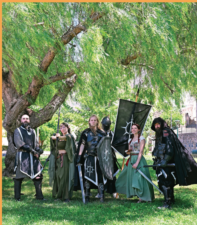
Interview complète sur ville-lagarde.fr Infos et contact : crepuscule-var.fr

« Nous sommes une vingtaine d'adhérents : rien ne serait possible sans leur passion ! Décors, costumes, mise en scène... Chacun apporte sa pierre à l'édifice. Et, sous les armures se cachent de véritables maîtres des arts martiaux. Derrière nos démonstrations, il y a une grande rigueur technique et le goût de transmettre les valeurs humanistes que véhicule l'idéal chevaleresque. »