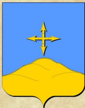
LA BASSE CHABOSSIÈRE

Nom d'origine latine « Caput », la bosse et « ièra », de sens collectif. Chabossière signifie donc hameau situé près d'une bosse (Une hauteur de terrain). Le site est partagé en deux : Celle située entre 150 et 160m d'altitude porte le nom de Basse-Chabossière, l'autre, située entre 160 et 170m d'altitude est dénommée la Haute-Chabossière.