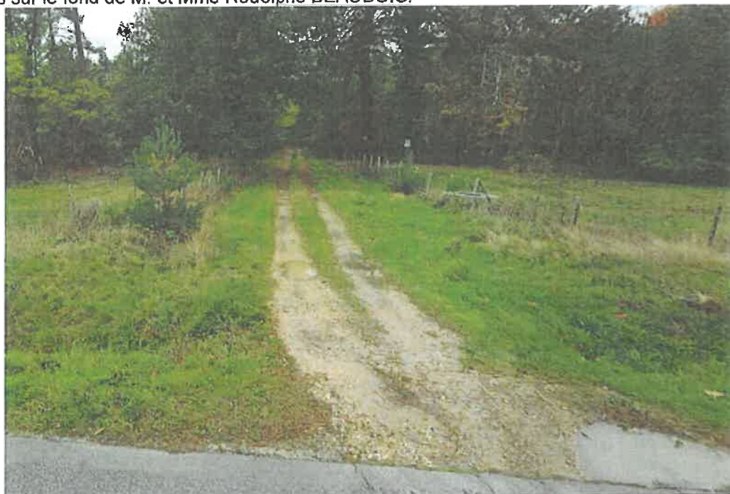
Photographie de l'accès du chemin depuis la RD n°55 – Route de Viglain