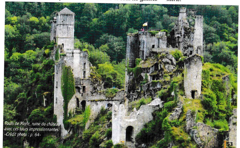
Tours de Merle, ruine du château avec ces tours impressionnantes. -Crédit photo : p. 64-

Extrait du topoguide Chamina Édition "La Corrèze", article de A. Chanonat, avec l'aide de P. Gire, passionné des tours de Merle.