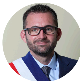
Romain BARTHET-BARATEIG Maire