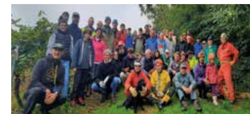
Journée participative, septembre 2025

Ses efforts ont permis de faire des découvertes fascinantes : ossements humains, artefacts en silex, fossiles, stalactites et concrétions, autant de trésors qui racontent l'histoire très ancienne de Péronne.