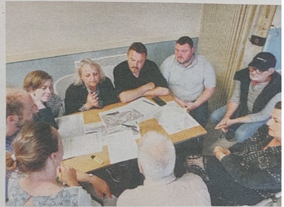
Les habitants ont pu participer en donnant leur avis sur plusieurs thèmes.

La carte communale sera finalisée début 2023.