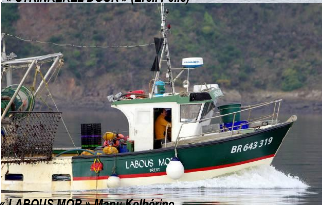
« LABOUS MOR » Manu Kelbérine

Un nouveau coquillier à Pors Beac'h. La campagne de dragage de la coquille Saint-Jacques bat son plein depuis le 18 octobre dernier et se poursuivra jusqu'en avril prochain. Avec l'arrivée du « Menez Du » (7 ème bateau de la flotille), Pors Beac'h devient le second port coquillier de la rade après Brest.