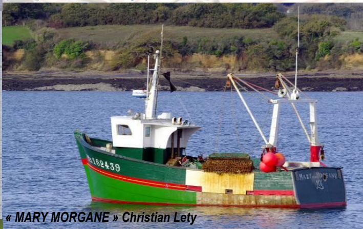
« MARY MORGANE » Christian Lety

Un nouveau coquillier à Pors Beac'h. La campagne de dragage de la coquille Saint-Jacques bat son plein depuis le 18 octobre dernier et se poursuivra jusqu'en avril prochain. Avec l'arrivée du « Menez Du » (7 ème bateau de la flotille), Pors Beac'h devient le second port coquillier de la rade après Brest.