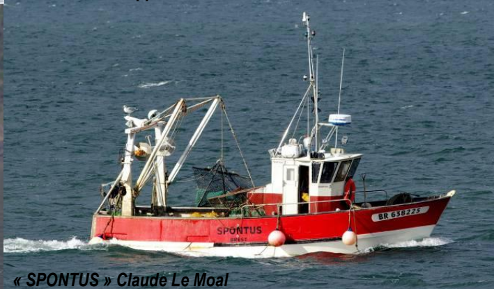
« SPONTUS » Claude Le Moal