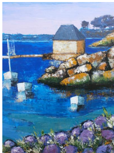
« Couleurs sur le quai »

MARCELLE CARIOU , huiles, pastels et acryliques. Tous les jours de 14h à 19h