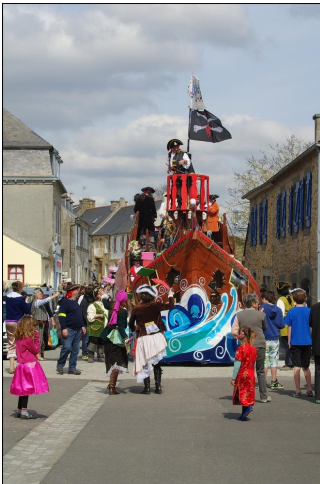
Carnaval à Logonna Grosse ambiance dans la rue principale !

Le Costa Logonna, ses pirates et ses danseuses ont animé le défilé, suivis par les moussaillons de l'école, eux aussi déguisés. Foule des grands jours, bonne humeur et confettis garantis. Stationné devant Kejadenn, le char a pu être visité, pour le plus grand bonheur des enfants qui recevaient en cadeau une pièce d'or. Gros succès également pour la paella géante et la soirée festive. Bravo aux deux associations qui ont organisé cette journée : l'APE et Carnaval. Vivement le Carnaval 2016 !