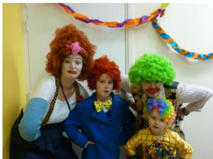
La famille clown : (Nous ne dévoilerons pas leur identité... !)