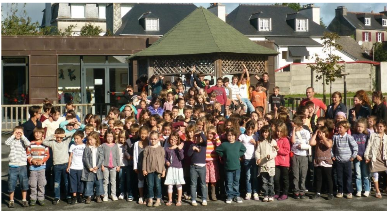
Les classes primaires