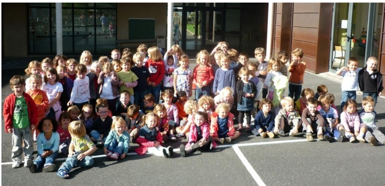
Les classes maternelles