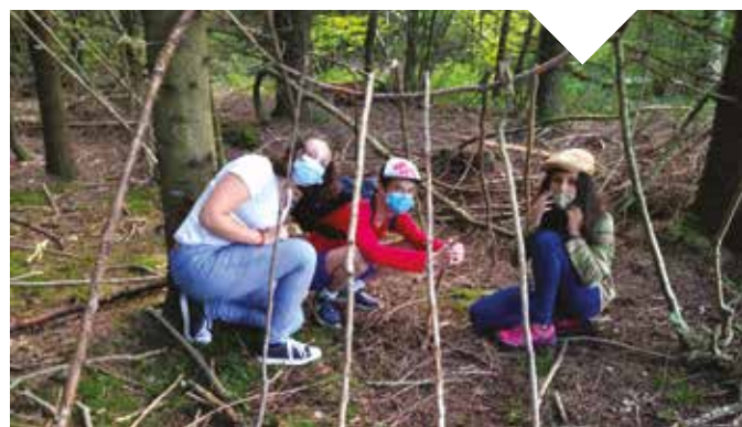
Sortie nature au parc des Dronières.

La première semaine a été l'occasion pour tous d'apprendre à se connaître, trouver ses repères, s'adapter au mieux pour respecter les gestes barrières et commencer les premiers cours. »