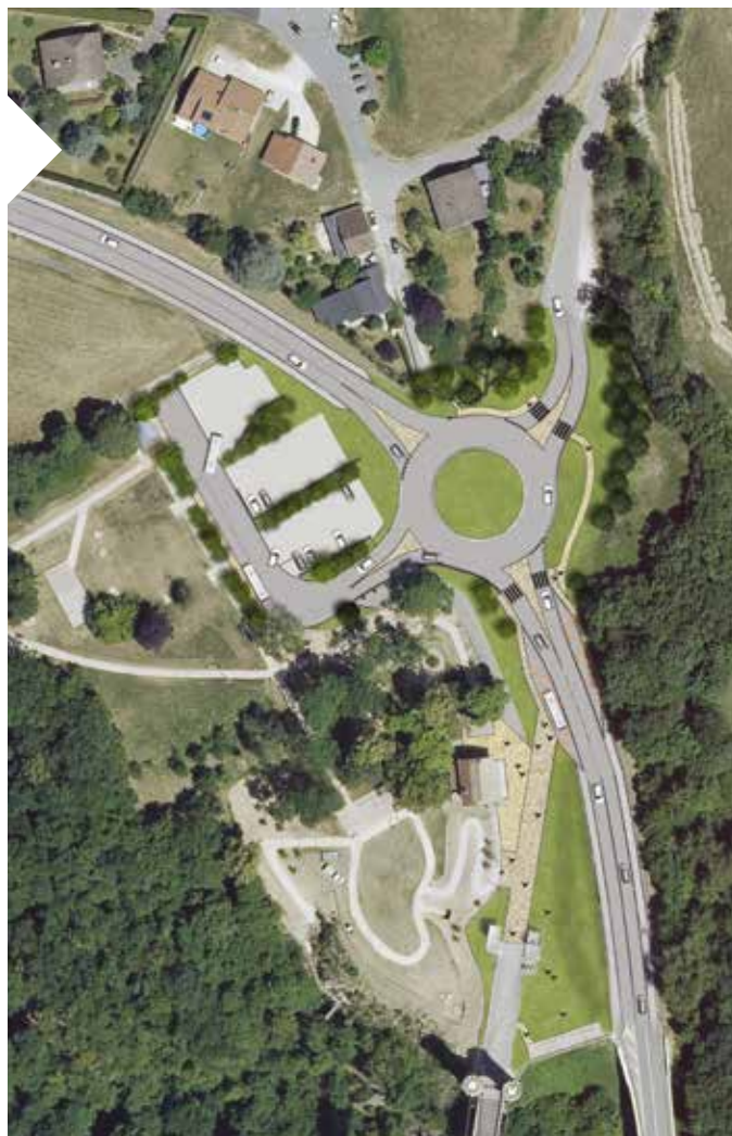
Emprise des travaux du rond-point des Ponts de la Caille.

Espérant que cette situation engendrera le minimum de gêne pour chacun et que les travaux se dérouleront dans les meilleures conditions, nous vous remercions par avance pour votre patience.