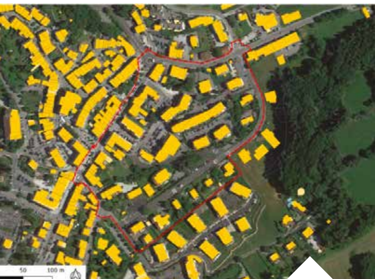
Périmètre d'étude - Secteur : Chef-lieu

Il s'agit donc d'une mesure d'urgence mise en œuvre rapidement pour freiner la densification dans l'attente de la révision du règlement du PLU.