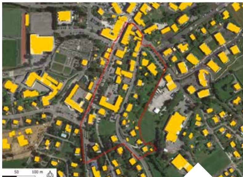
Périmètre d'étude - Secteur : Route du Suet Nord