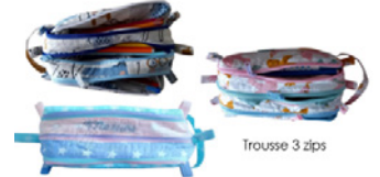
Trousse 3 zips