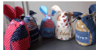
Souris à dent de lait