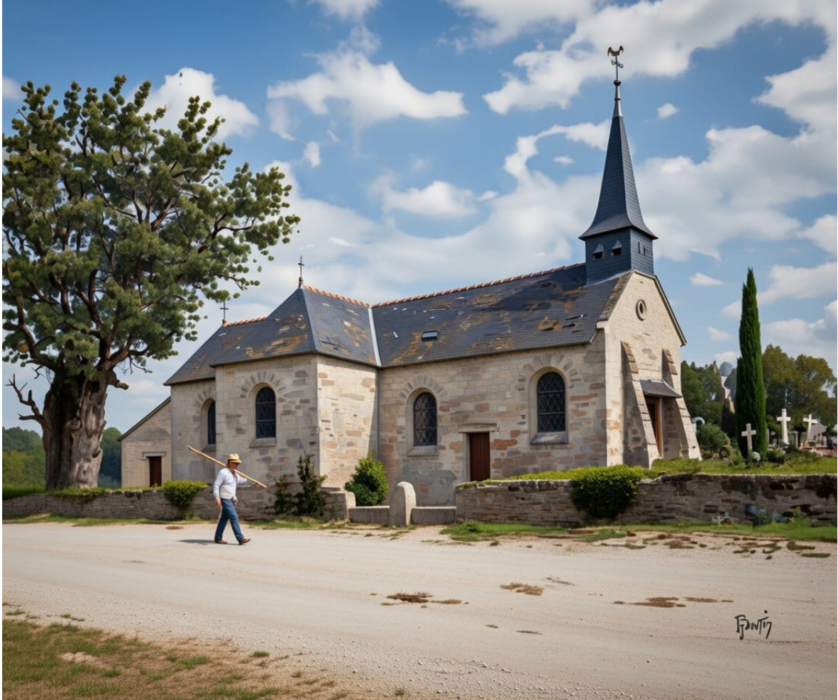
«Eglise démolie dans le cimetière en 1878 (image générée avec l'IA à partir de l'aquarelle peinte par un abbé Boutin, vicaire à Saint-Lumine-de-Coutais).»