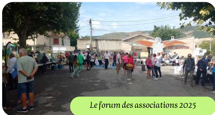
Le forum des associations 2025