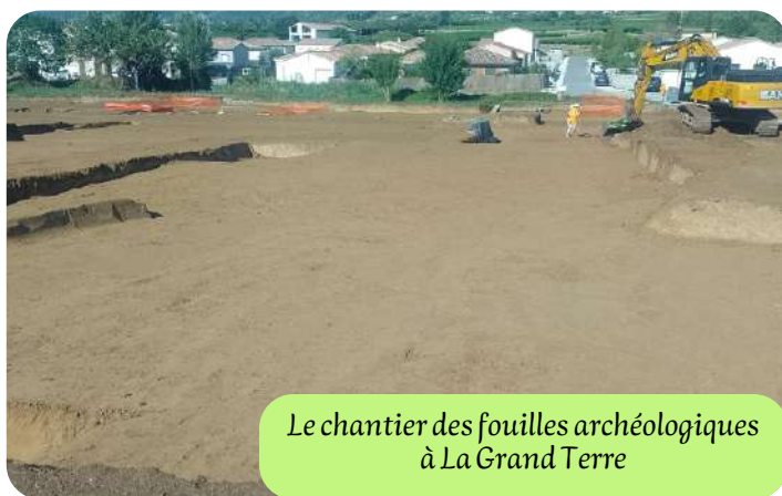
Le chantier des fouilles archéologiques à La Grand Terre