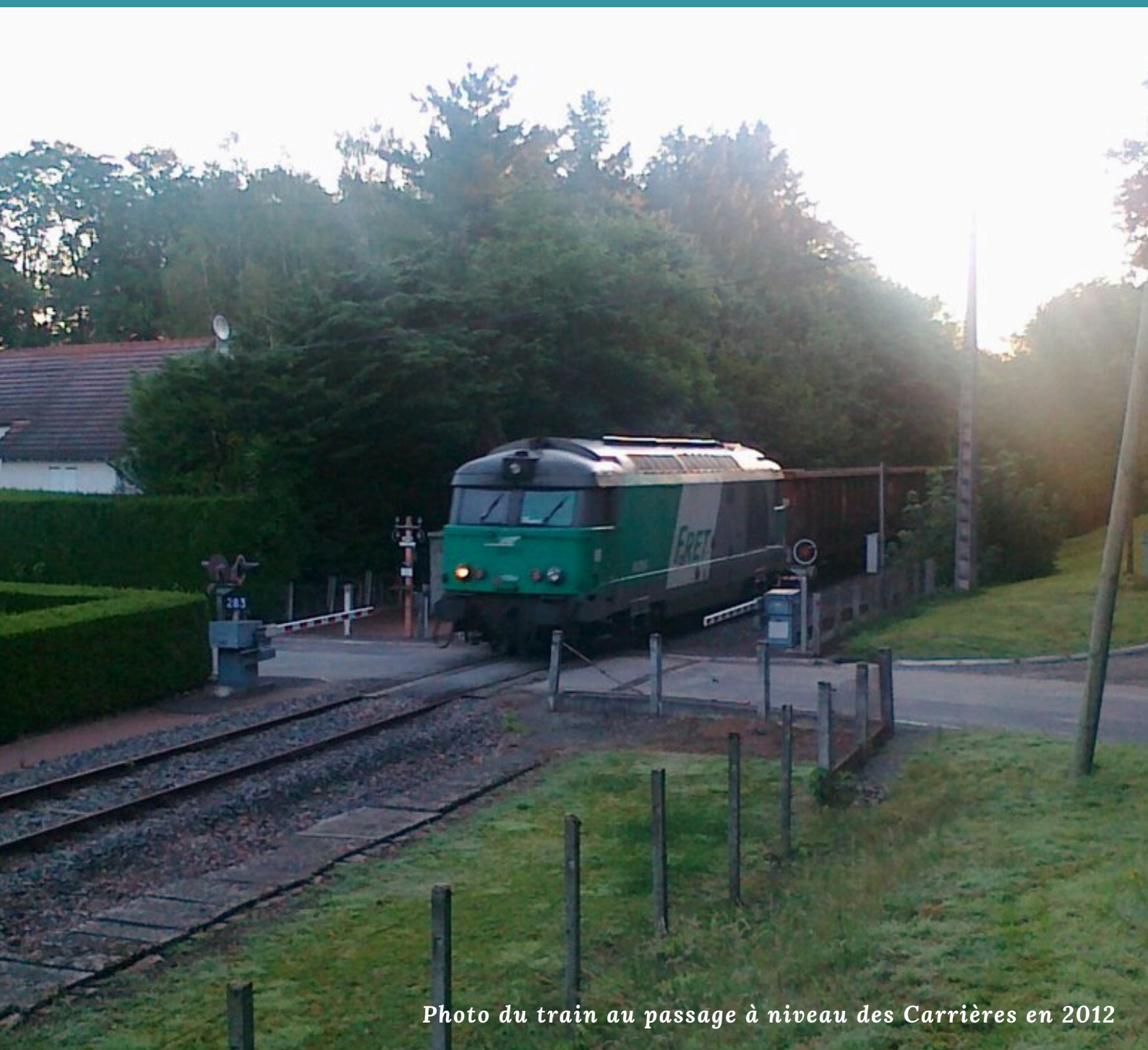
Photo du train au passage à niveau des Carrières en 2012