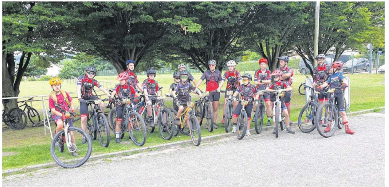
La Ponto Bike &amp; Risle partira de la salle des fêtes de Pont-Authou pour la première fois en 2026. ACPA

C'est un renouveau pour le Ponto Bike & Risle. Après trois éditions, la manifestation sportive change de cadre et s'installe à la salle des fêtes de Pont-Authou pour accueillir son départ, dimanche 19 avril. Un nouveau point de ralliement qui devrait permettre d'offrir aux partici-