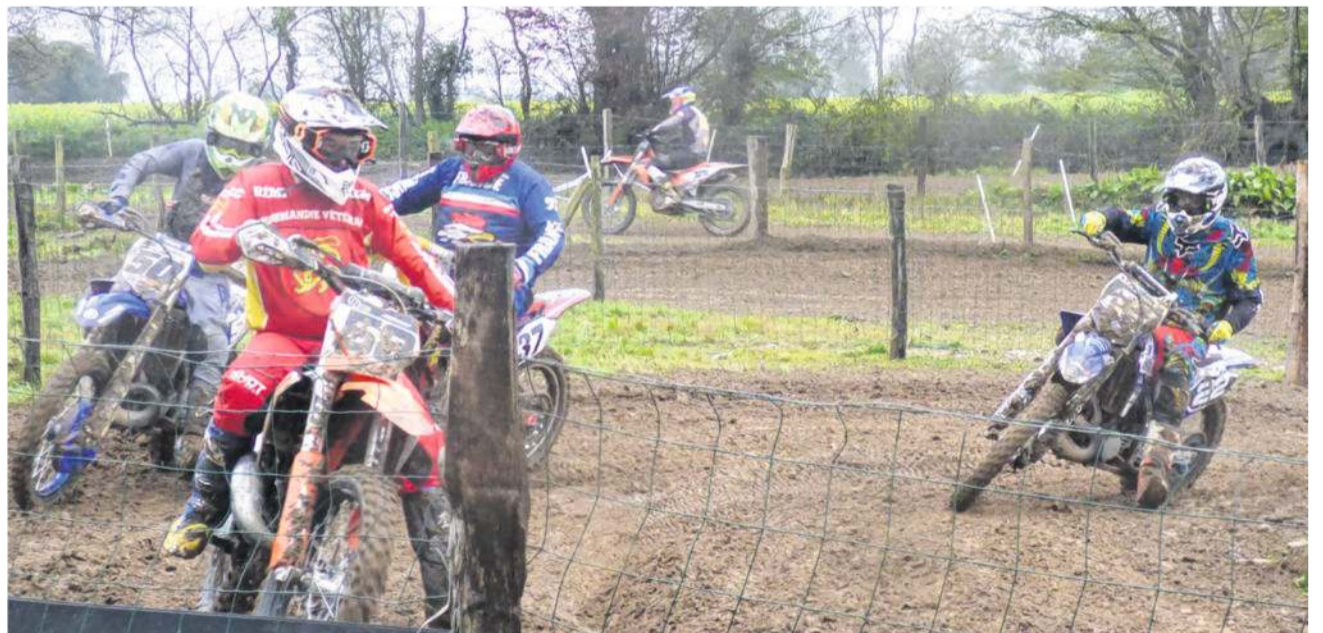
Cette année encore un peu plus que lors des éditions précédentes, il va y avoir du spectacle au moto-cross de Saint-Cyr-de-Salerno.

Pour la 20 e édition de son traditionnel moto-cross, le Moto club de Berthouville accueillera pour la première fois un championnat de France. Plus précisément, l'épreuve de coupe de France catégorie 450 cc - ce dimanche 12 avril sur le circuit de Saint-Cyr-de-Salerno.