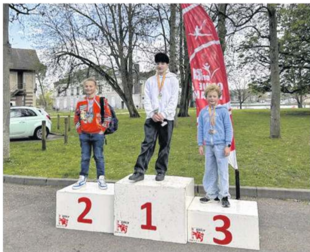
Au total, les jeunes du CK Val de Risle ont décroché cinq podiums à Vernon. CK Val de Risle

Samedi 28 mars, le CK Val de Risle était présent à la MiniPag de Vernon. Le club était représenté par cinq jeunes lors de la compétition jeune de course en ligne. Au programme, découverte en équipage le matin et courses (classique et australienne) l'après-midi. Concernant les résultats : Benjamine