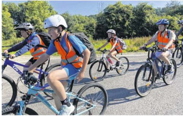
Le stage Savoir rouler à vélo se déroule du 20 au 24 avril. VCPA

Le Vélo club de Pont-Audemer (VCPA) organise du 20 au 24 avril 2026 un stage « Savoir rouler à vélo » entièrement gratuit, ouvert aux enfants et jeunes de 8 à 15 ans. Soutenue par la Ville de Pont-Audemer dans le cadre du Contrat de Ville, cette action vise à transmettre les bases d'une mobilité active, sécurisée et autonome.