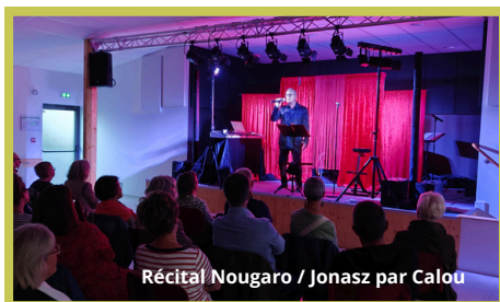
Récital Nougaro / Jonasz par Calou