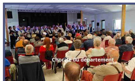
Chorale du département