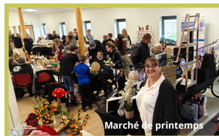
Marché de printemps