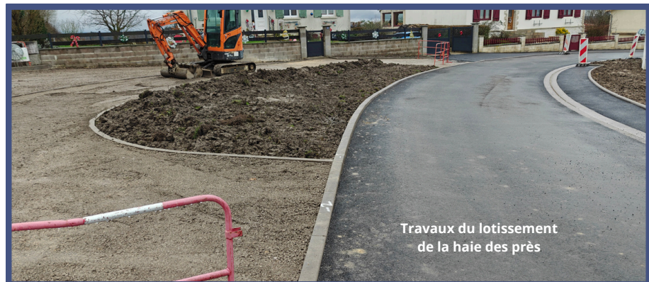
Travaux du lotissement de la haie des près