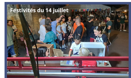
Festivités du 14 juillet