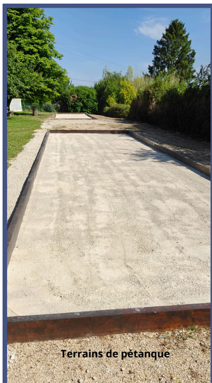
Terrains de pétanque