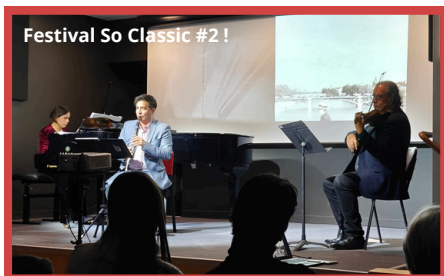
Festival So Classic #2 !