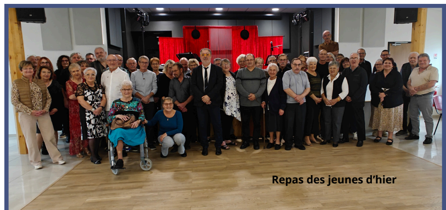
Repas des jeunes d'hier